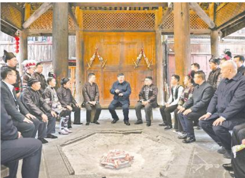
3月17日至18日,中共中央总书记、国家主席、中央军委主席习近平在贵州考察。这是17日下午,习近平在黔东南州黎平县肇兴侗寨考察时,在信团鼓楼同村干部和村民代表围坐在火塘边,共话乡村全面振兴。

习近平指出,高质量发展是中国式现代化的必然要求。贵州要下定决心、勇于探索,坚持以实体经济为根基,强化创新驱动,统筹新旧动能转换,加快