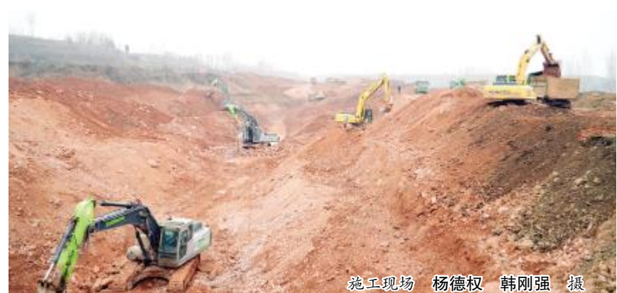
施工现场