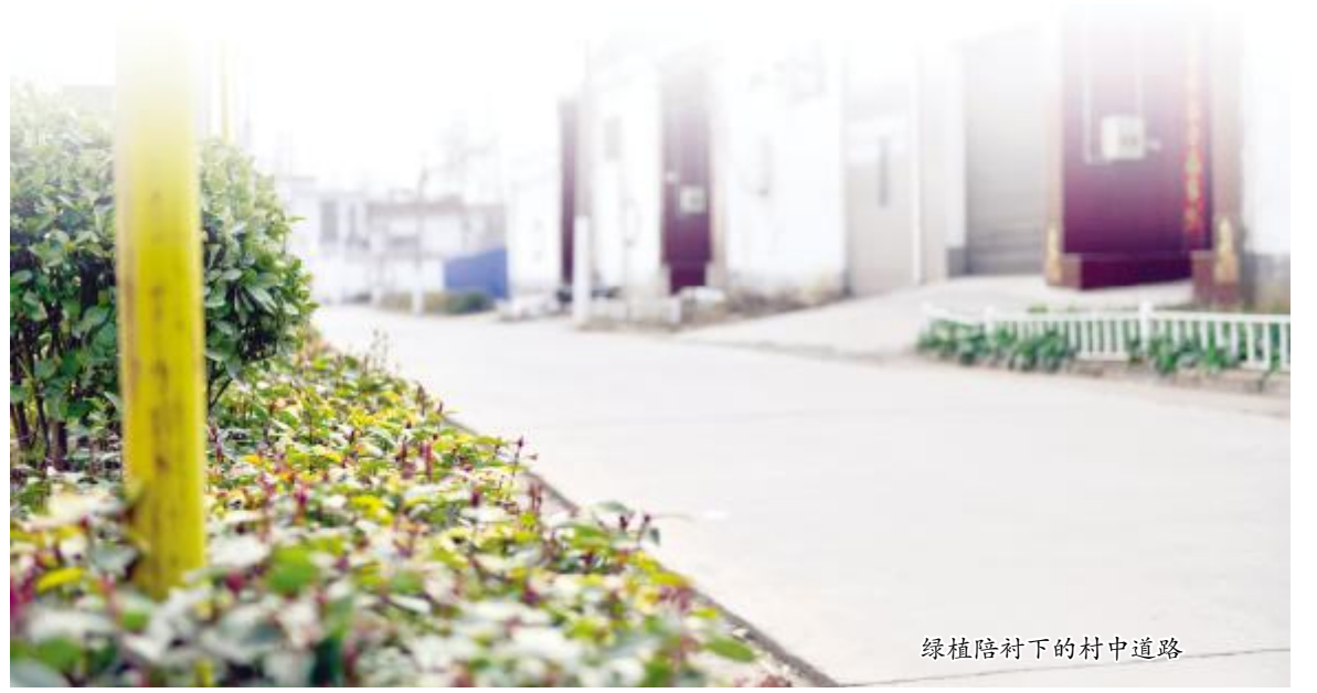
绿植陪衬下的村中道路