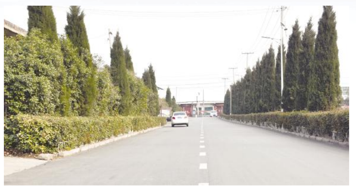
干净整洁的柏油路

整洁的乡村道路,错落有致的村居民舍……2月24日,走进临汝镇菜园村,一幅新时代美丽乡村画卷跃然眼前。