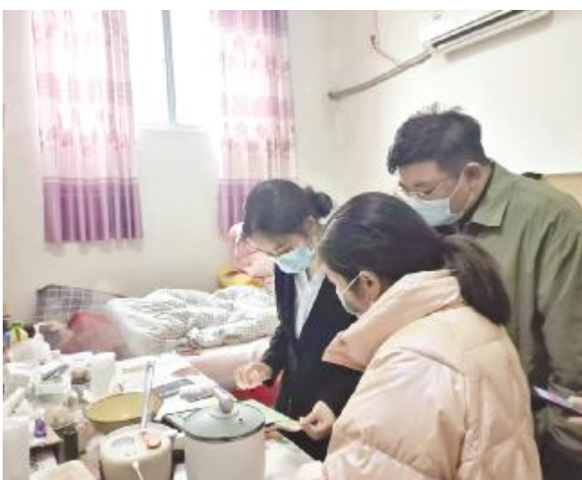
工作人员上门服务

直致力于为群众提供便捷、高效的服务。无论是线上办理还是上门服务,中心都在不断探索和努力,旨在让每一位群众在办理业务时都能感受到实实在在的便利与温暖。下一步,市住房公积金管理中心将继续秉持初心,