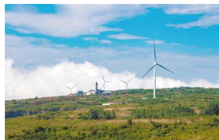
云海缭绕磅礴如画