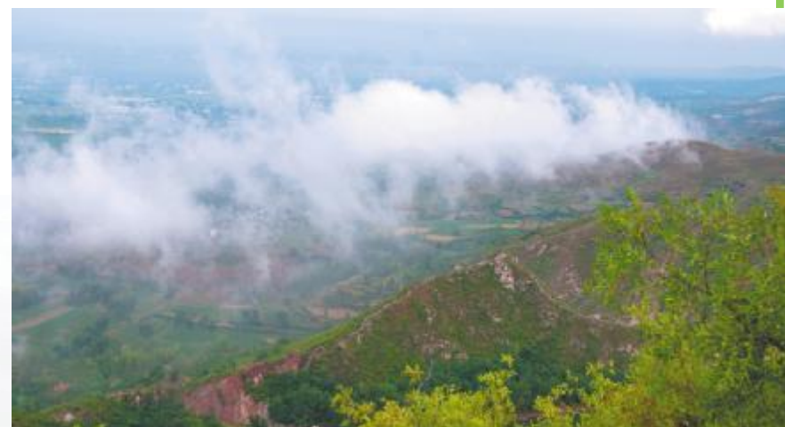
云雾升腾青山苍翠