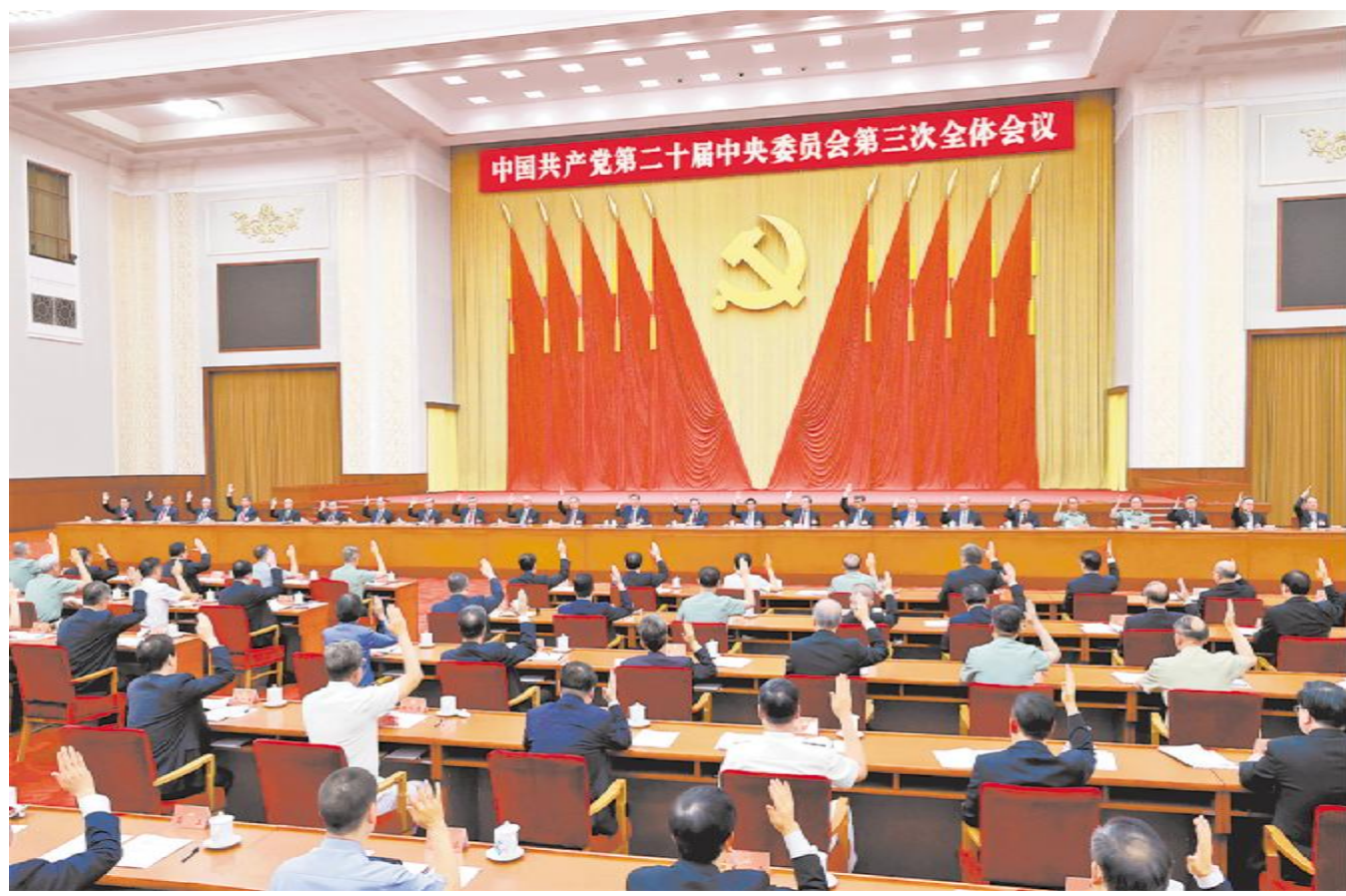
中国共产党第二十届中央委员会第三次全体会议,于2024年7月15日至18日在北京举行。中央政治局主持会议。