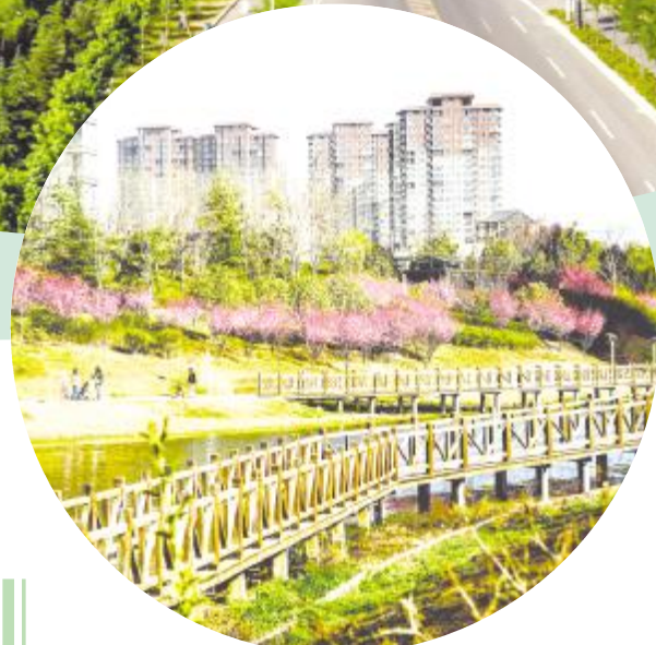
春日里的洗耳河畔