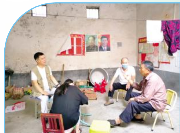
实地走访困难师生家庭

发展过程中发挥着积极作用，对于推动教育发展、提高教育质量、促进教育公平、推进教育改革都有着不可忽视的作用。时至今日，基金会共救助困难师生1.24万余名，救助大病师生(包含教师直系家属)900余名，奖励优秀师生5.61万余名，表彰各级各类学校700余所。除此之外，还对一些山村学校、薄弱学校、特殊教育学校、幼儿园等教育机构的发展，给予大力支持。