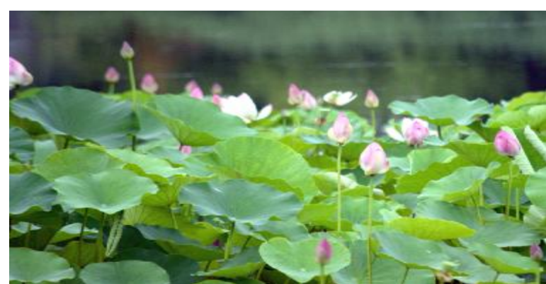
芙蓉披红鲜