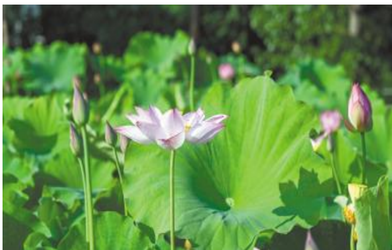
凌波仙子静芬芳