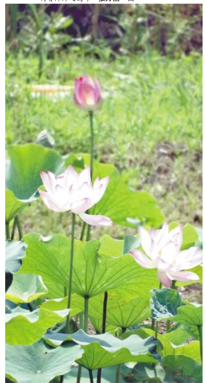
袅袅水芝红