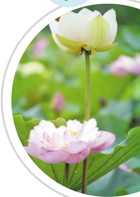
荷花争艳醉人心