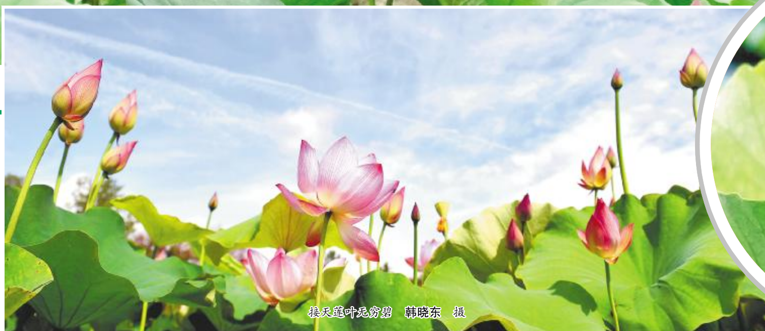
接天莲叶无穷碧