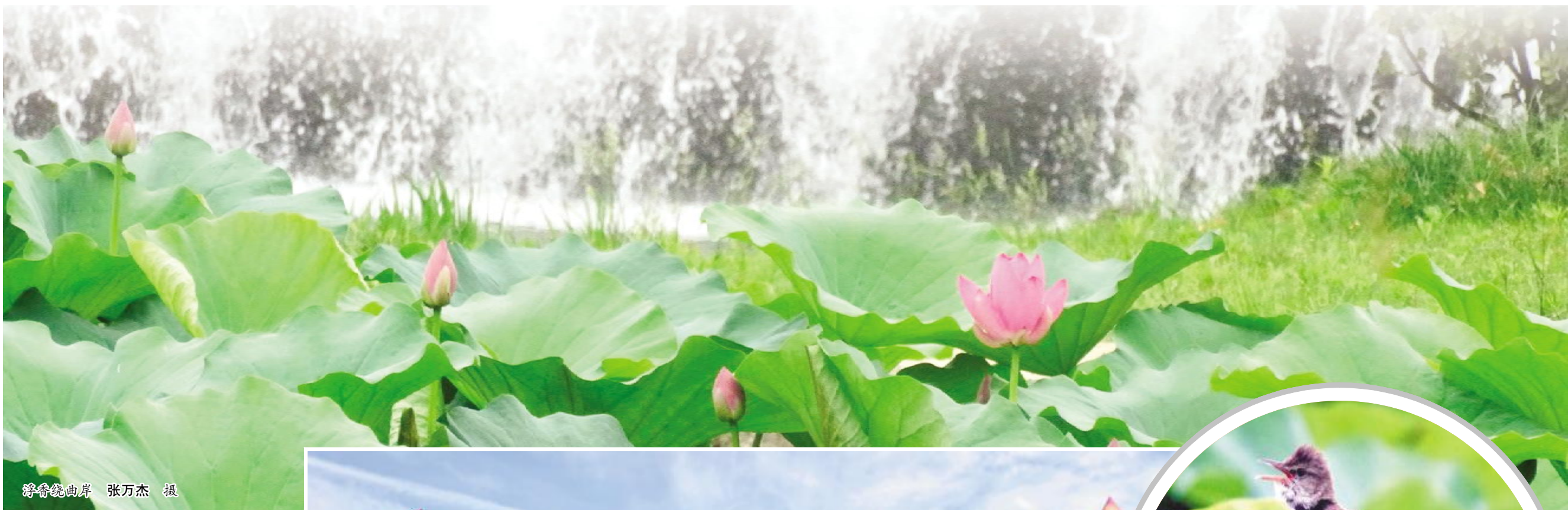
静倚绕曲岸