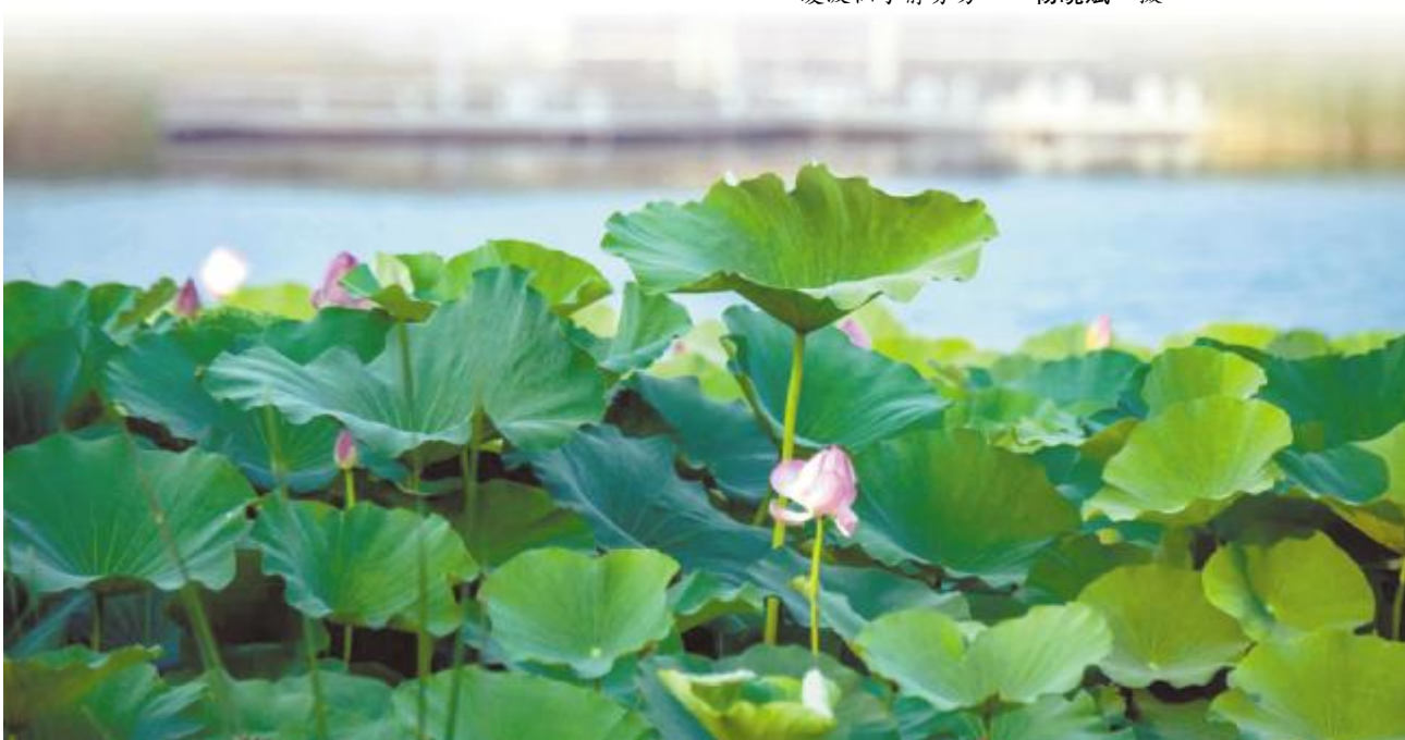
荷花镜里香