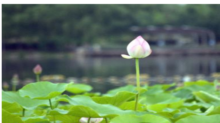
小荷才露尖尖角