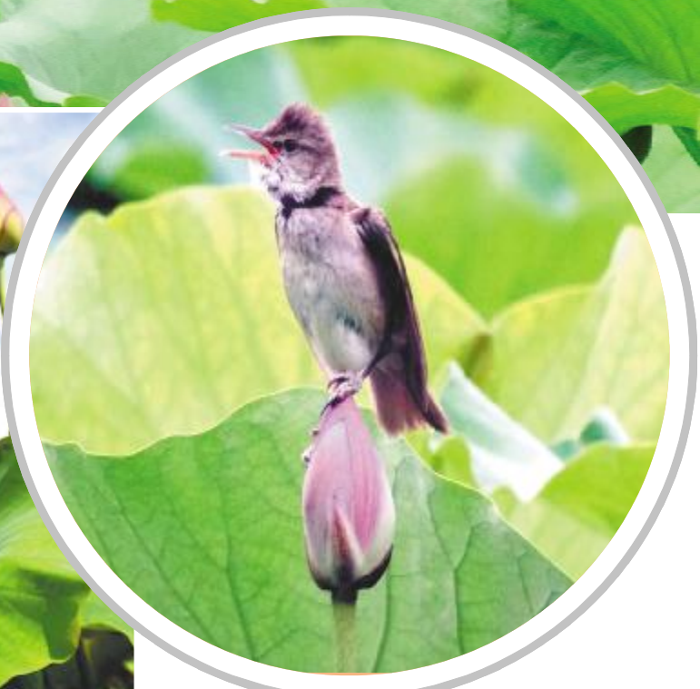
荷香阵阵飞鸟啼