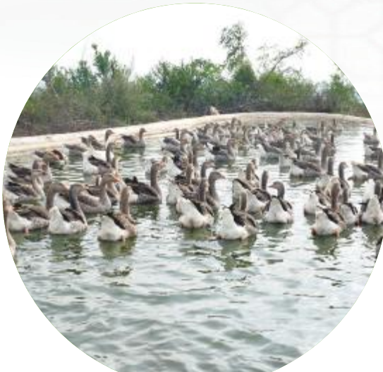
石榴果园内养殖的大雁