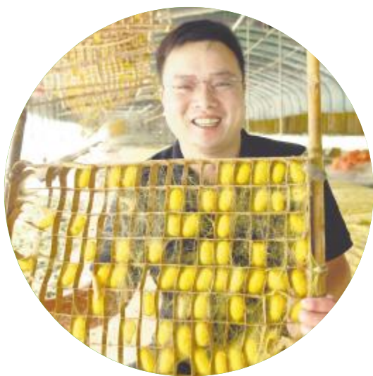
蚕桑养殖户展示黄金蚕茧