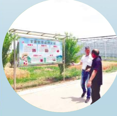
中国财经报记者走访小寨村甘薯产业园