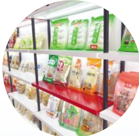
甘薯加工产品琳琅满目

为突出“一村一品”特色,汝州市加快提升产业综合效益。坚持因地制宜,结合我市地域特征和自然优势,初步形成东蔬、北林、南牧、西粉的农业产业布局。利用东部平原地区土壤肥沃、灌溉条件好的优势,在纸坊镇、辐射焦村、米庙、钟楼等乡镇(街道),发展高效种植业。在北部大峪、焦村山区,大力发展花椒、桑蚕、石榴等林果基地。目前,大峪镇发展花椒种植1.5万亩,焦村镇发展软籽石榴2000亩并获国家质检总局生态原产地保护产品认证和国家级生态农场认证,发展桑树种植3000亩,初步形成集桑树种植、养蚕、桑产品加工、销售为一体的桑蚕产业。