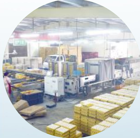
中王农牧鸡蛋分拣车间