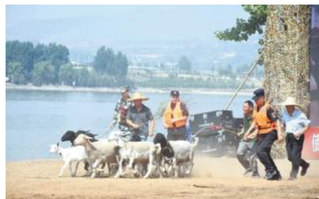
帮助群众转移牲畜