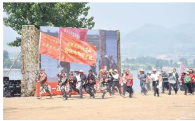
带领群众紧急转移