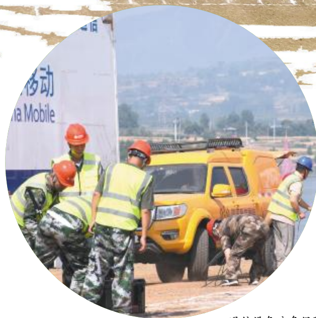
通信设备应急保障