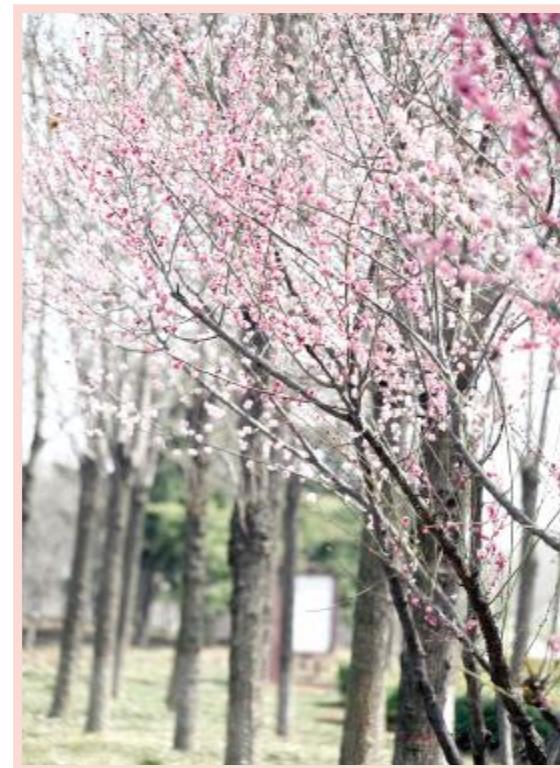
风恬日暖荡春光