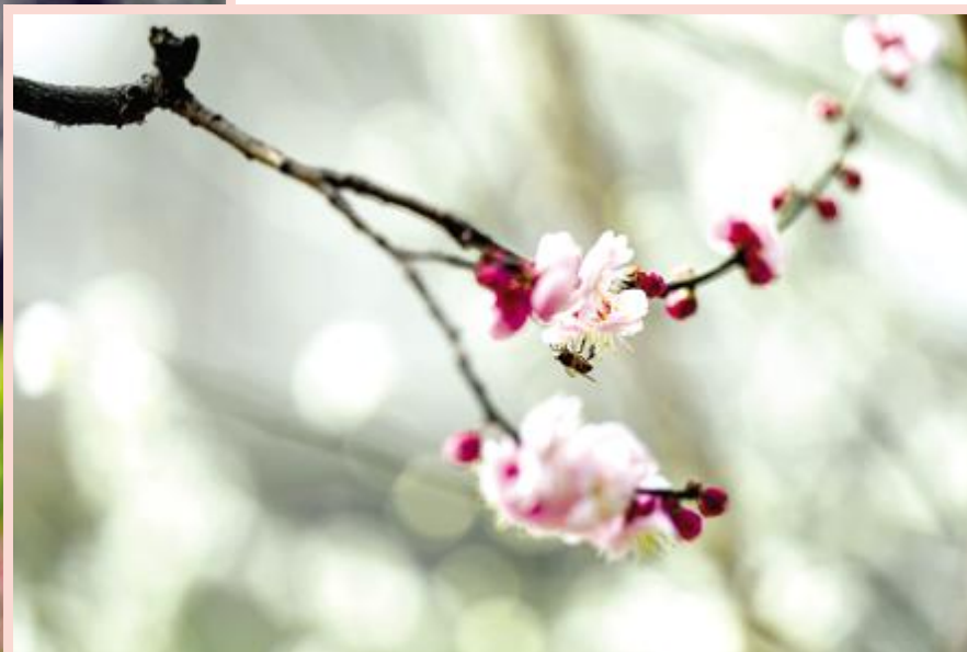
满树芬芳惹蜂来