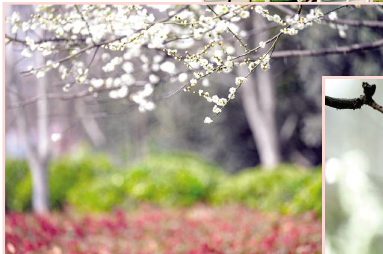
白杏枝头春意闹