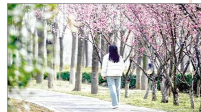
走在春天里