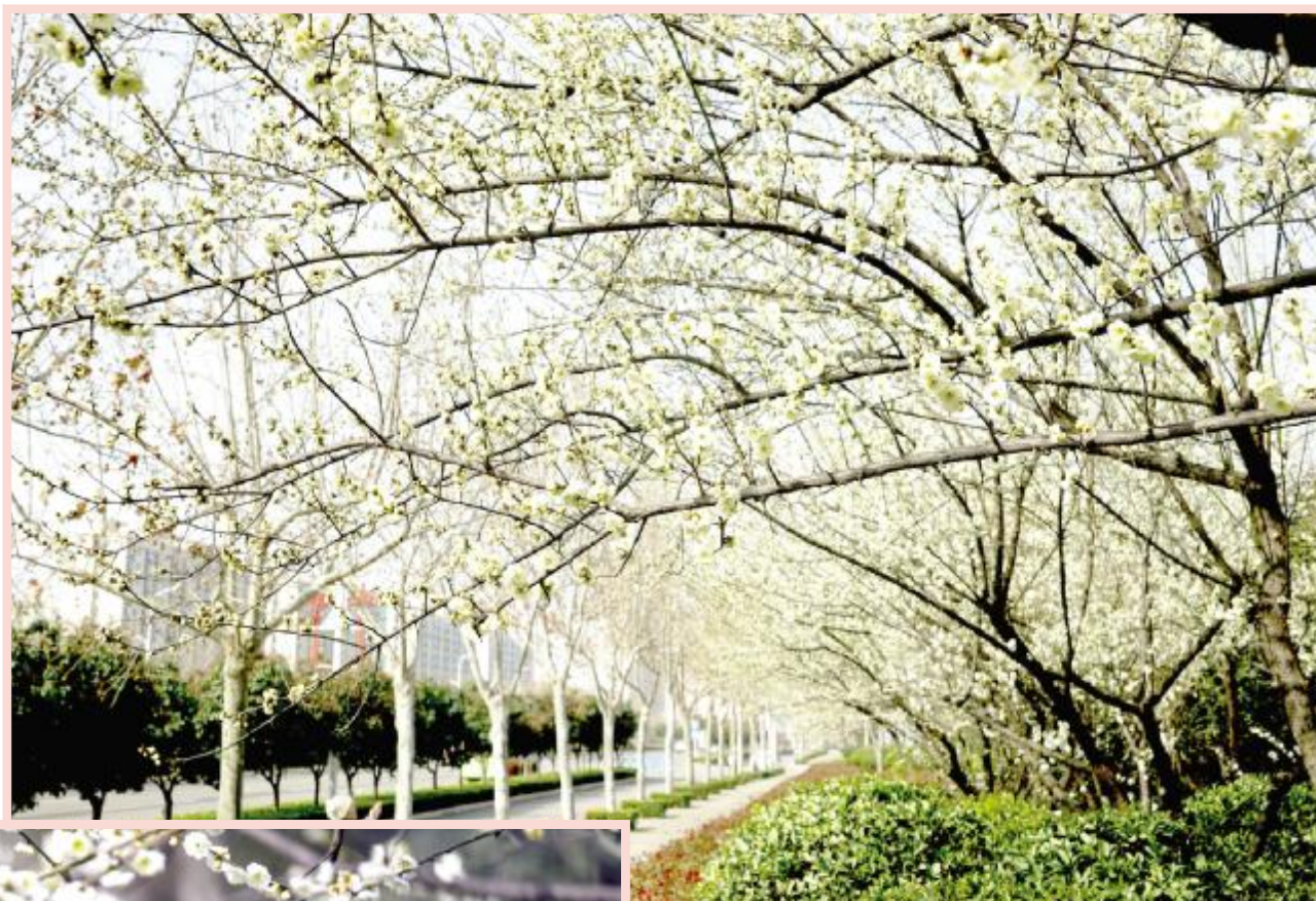
春花三月闹斑斓

漫步东区各个公园，梅花、杏花、玉兰花……花开正艳。各色春花闹斑斓，绽放时清香四溢，美得无暇且纯粹，给汝州烂漫春日里，增添一抹淡雅绚丽的美感。这股景致，邀您共赏。