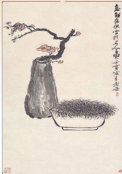
〔清〕吴昌硕《岁朝清供》

天寒地冻，围炉欢庆，家人团坐，灯火可亲。春节，明明是一年之中最为寒冷的时候，然而就人们的心理而言，却春意盎然。贴门神、放爆竹、吃饺子、饮屠苏酒、拜年、祭祖……春节沉淀下来的习俗丰富多彩，甚至衍生出为庆祝新年而绘制的节令画——“岁朝图”，承载着人们迎新祈福的美好愿望。