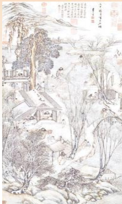
〔明〕李士达《岁朝村庆图》轴