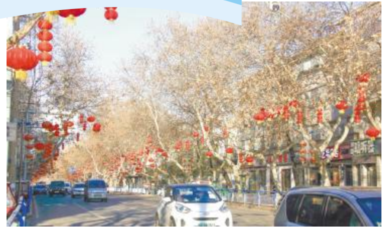
街头新春氛围浓