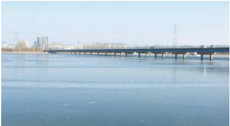
河面明亮如镜面

一年有四季，季季不同景。季节的变换带来了斑斓的美景，使汝州的冬日也成为值得珍藏的季节。这个冬日，不妨走出家门慢慢欣赏，或跟随镜头一同去饱览汝州的冬日风光吧！