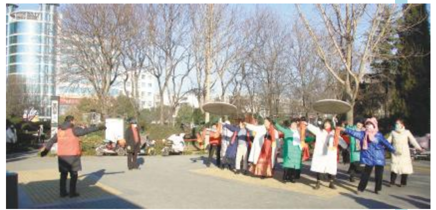
载歌载舞生活美