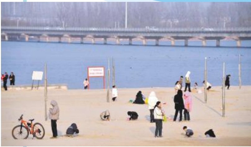
汝河沙滩乐游人

寒冷的冬日，大自然以她独特的笔触，谱写了一曲如诗如画的旋律。汝州的冬日，如同一幅令人陶醉的画卷，细腻入微，赋予这个季节一份独特的诗意。