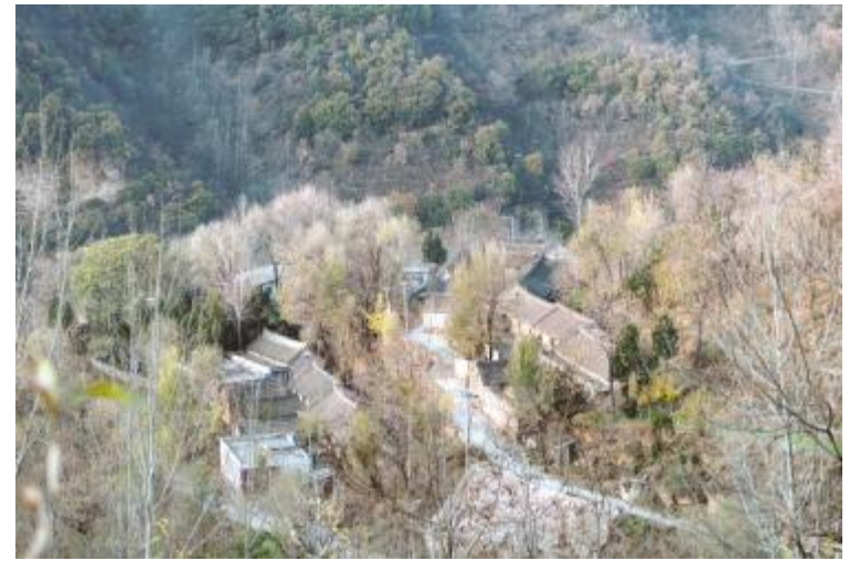
半山深处有人家