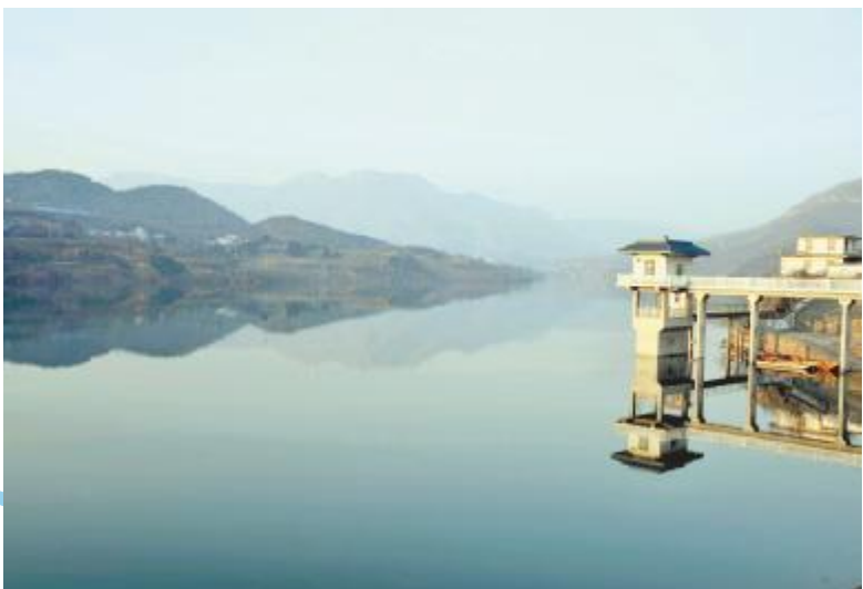
安沟水库景如画