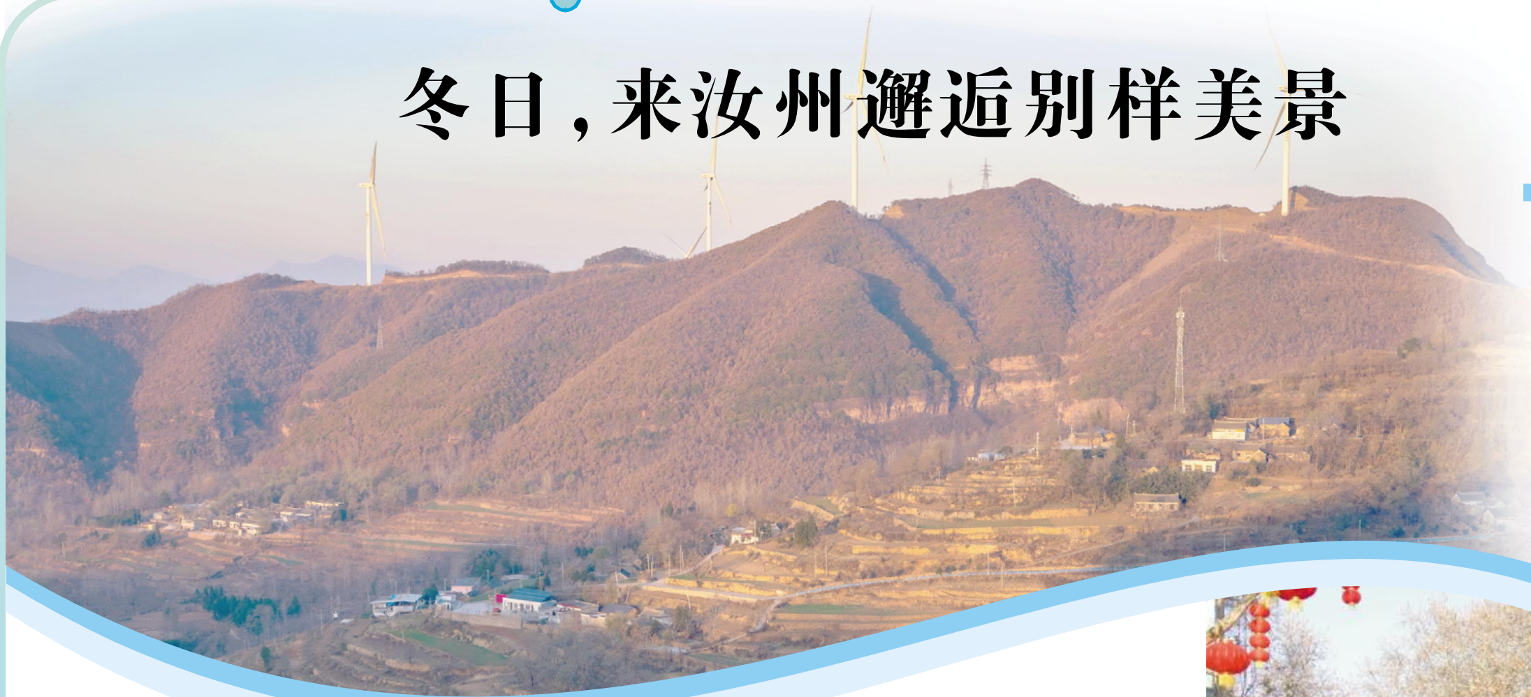
山川田园本秀色