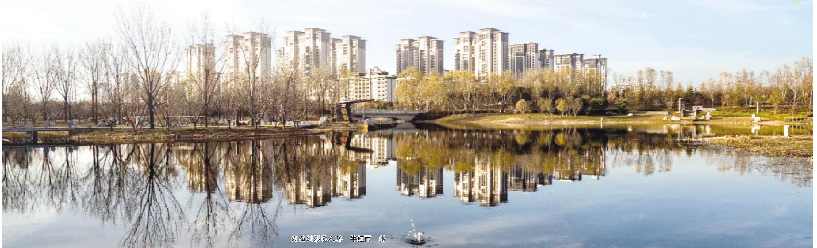
湖面倒影惹人醉