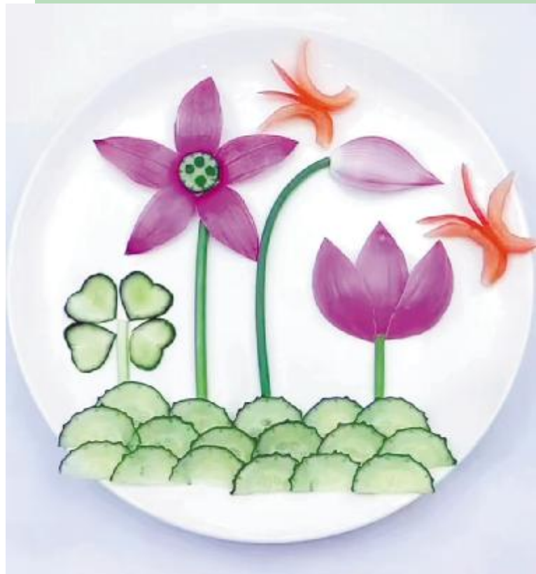
荷叶罗裙一色裁 滨河路小学 郭梓铃 作