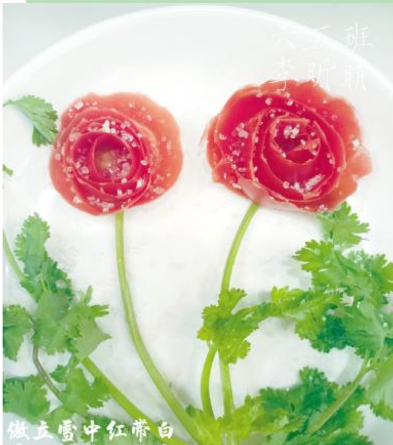
傲立雪中红带白 滨河路小学 李昕晴 作