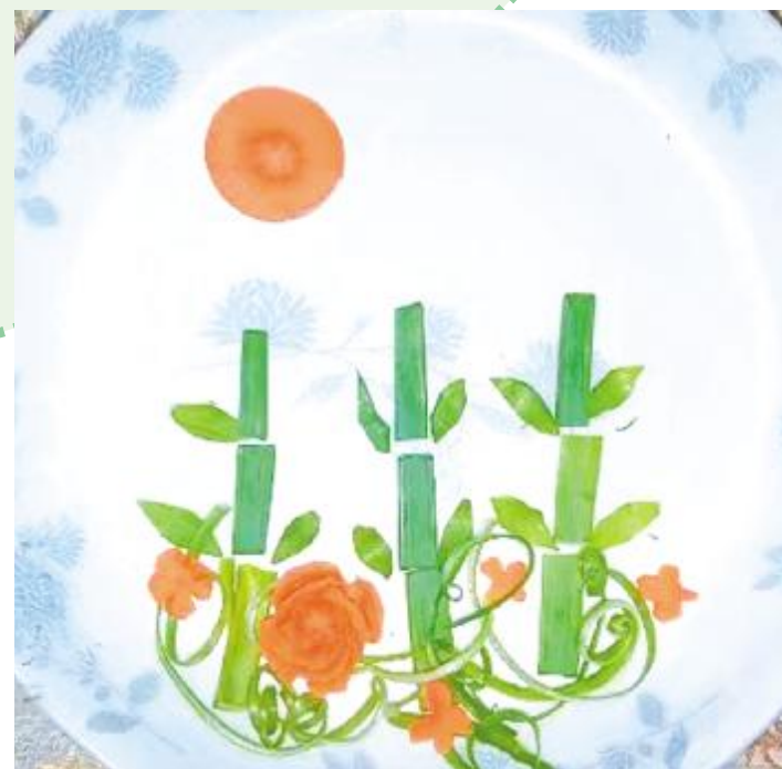
擢擢当轩竹 滨河路小学 李梦雪 作