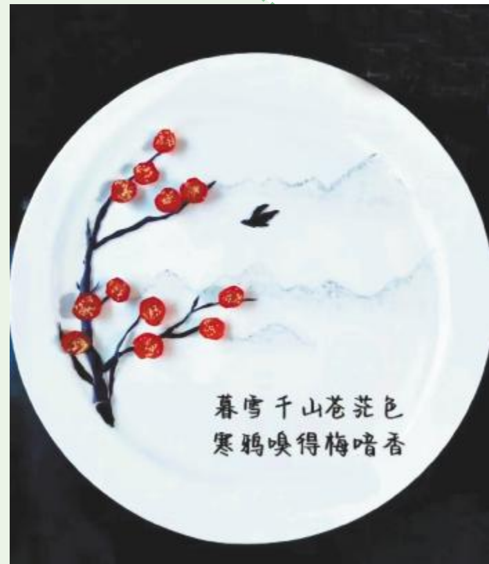
暮雪千山苍苍色 滨河路小学 田沂欣 作