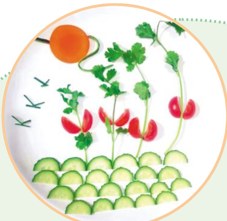
何处春江无月明 滨河路小学 许一偲 作