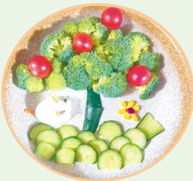
白兔捣药成 滨河路小学 郭欣冉 作