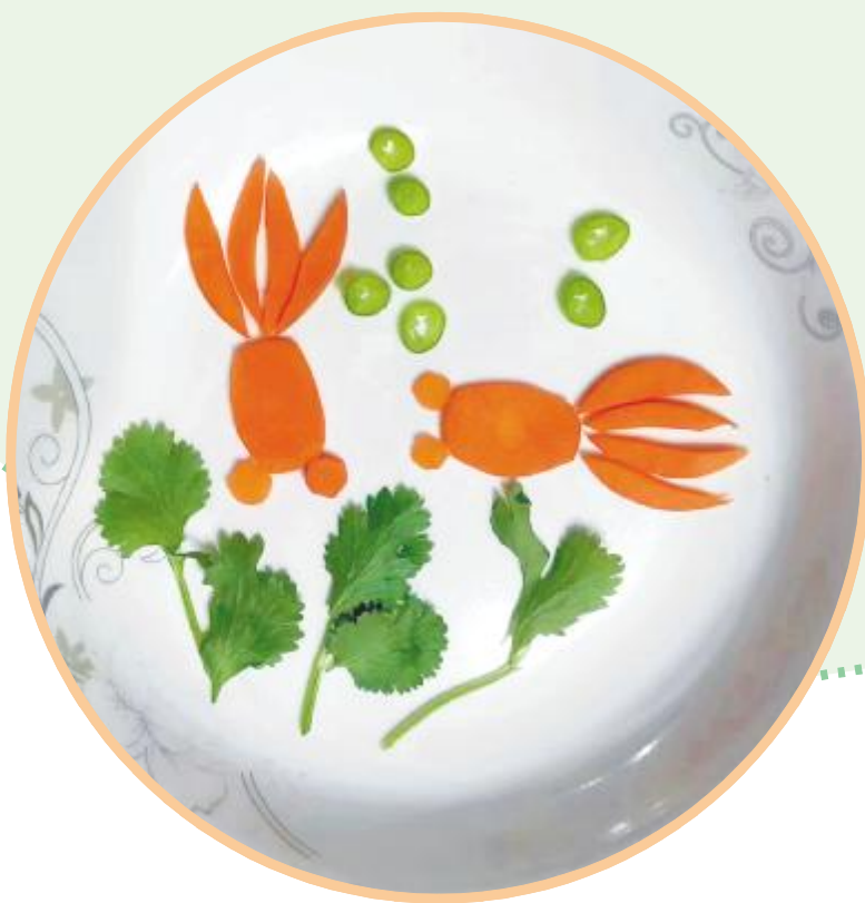
鱼戏莲叶间 滨河路小学 柳茗语 作