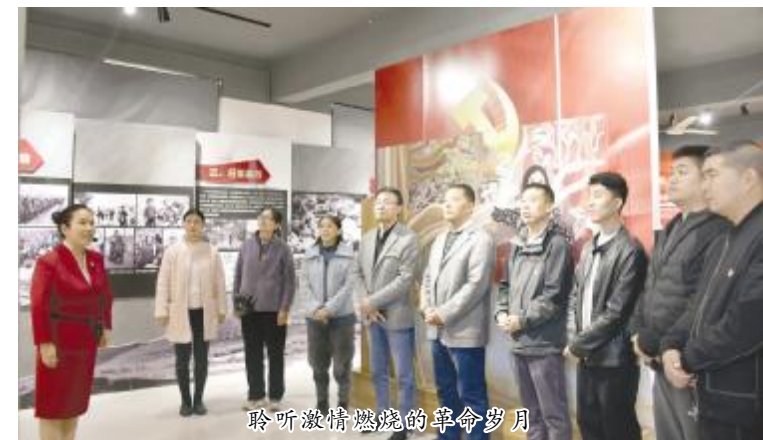
聆听激情燃烧的岁月

本报讯 (融媒体中心记者 陈晶晶) 在第二十四个记者节到来之际,11 月 8 日,市融媒体中心机关第二党支部组织党员来到米庙镇枣树庙村的马英烈士纪念馆参观学习,倾听“汝州刘胡兰”——马英为保守党的机密,面对敌人的酷刑摧残,坚贞不屈、英勇牺牲的感人故事,追寻红色足迹,汲取奋进力量。