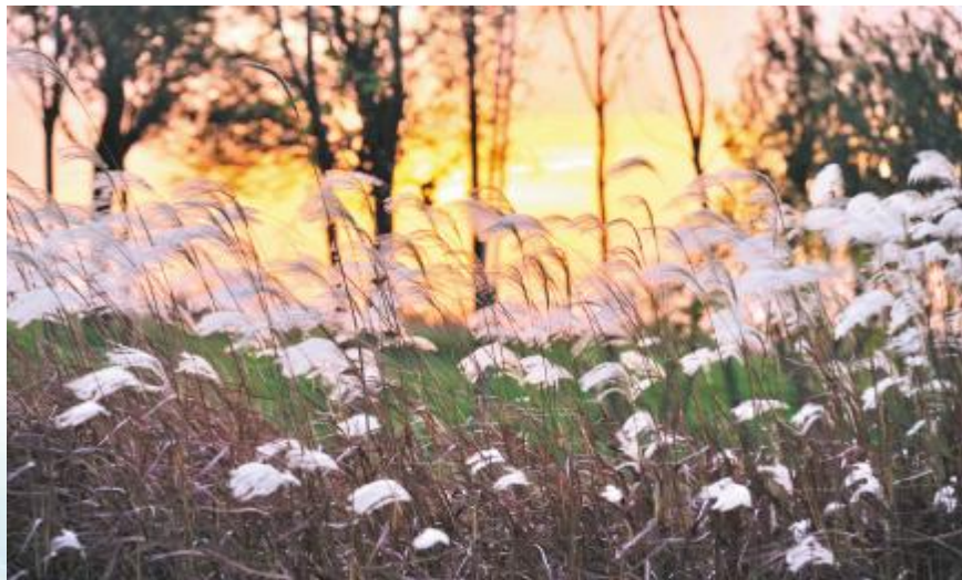
夕阳里的秋景