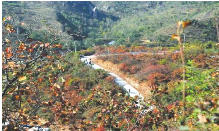
簇簇红叶点染山间