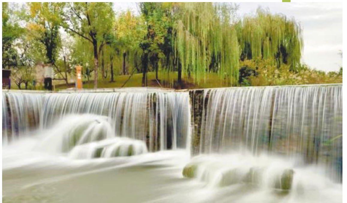
秋日限定美景