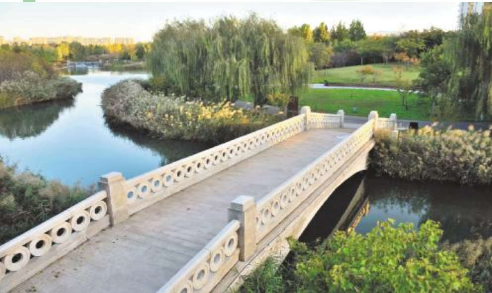
公园美景如画

深秋时节，飒爽秋色在美丽的汝州铺陈开来，变幻出五彩斑斓的世界。远处的山间云海叠嶂，多彩秋叶与和煦阳光交相辉映；市区内，湛蓝色的天空与缤纷的街道相得益彰……俯瞰汝州大地，绝美秋色如同一幅缓缓打开的美丽画卷，景色美不胜收，魅力愈发彰显，令人陶醉不已。