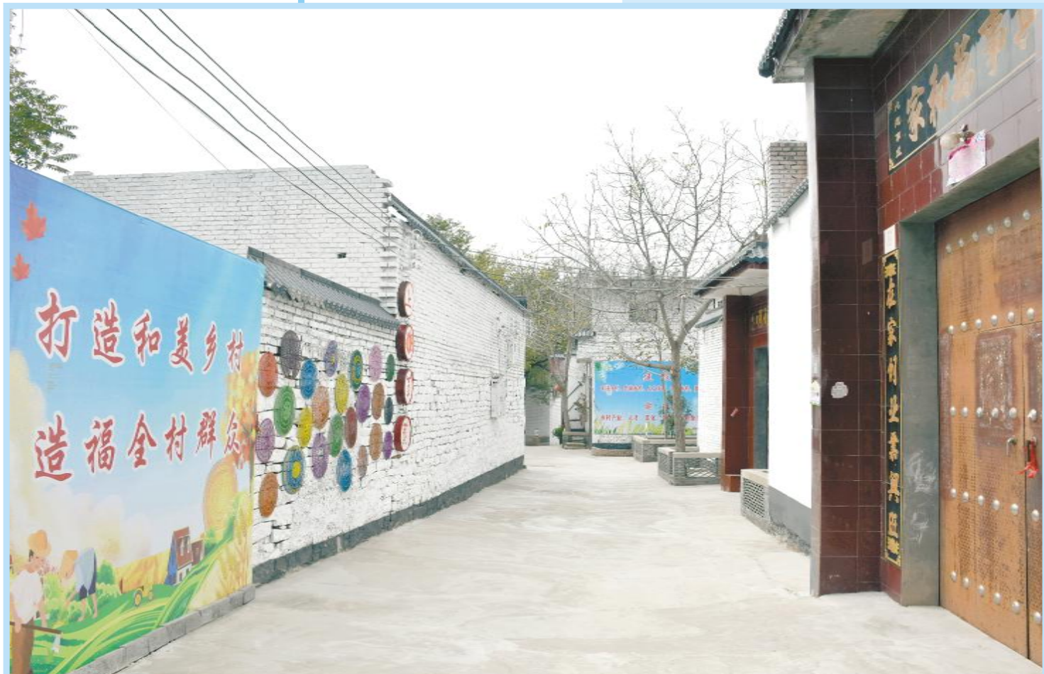
干净整洁的村中小道