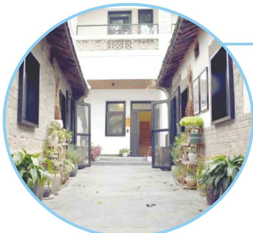
别具一格的农家院