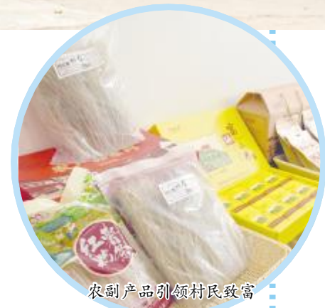
农副产品引领村民致富