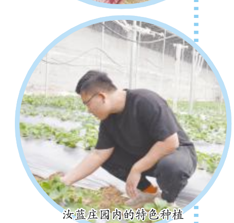
汝蓝庄园内的特色种植