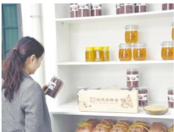
村民们的“甜蜜”事业