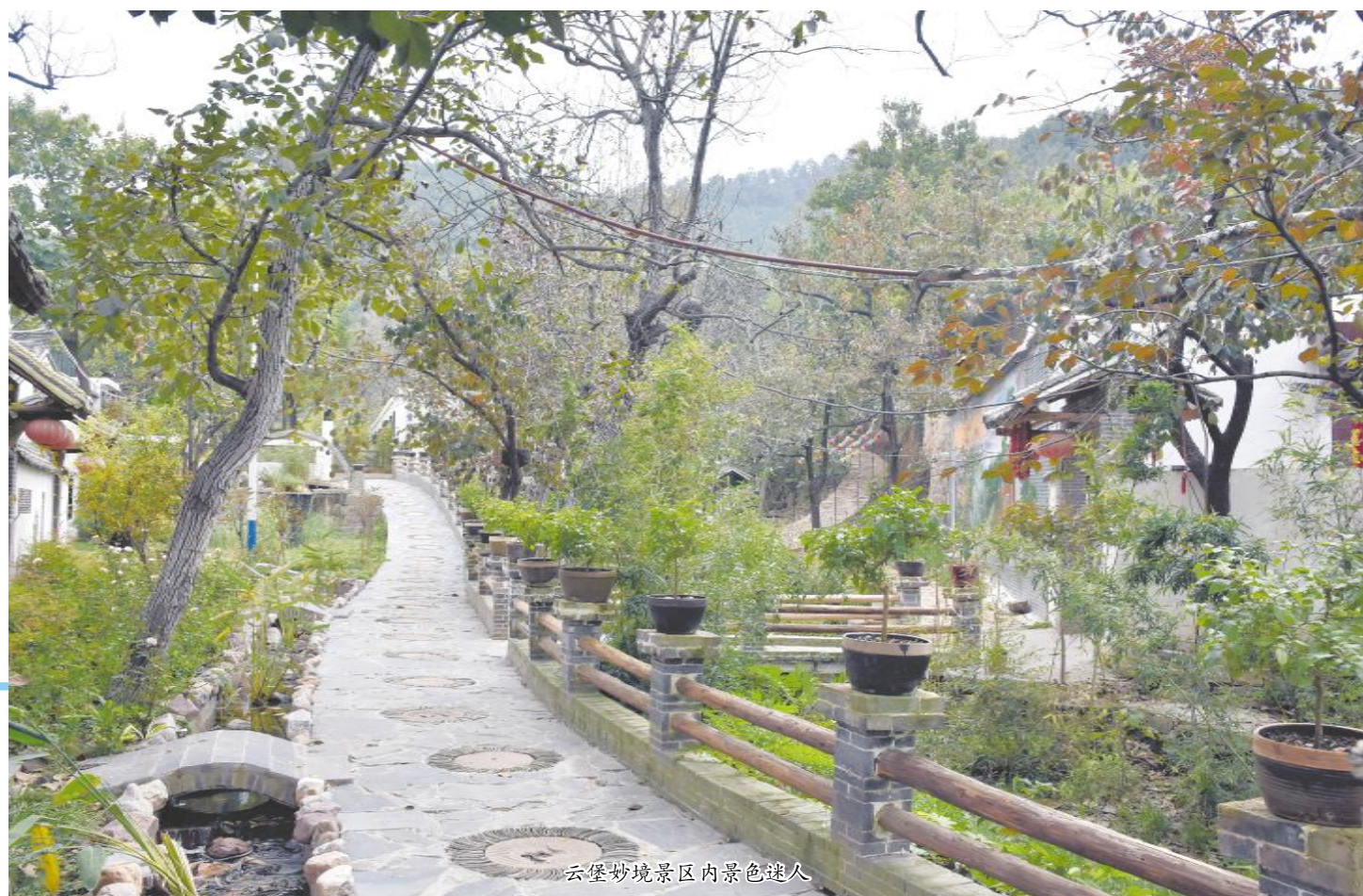
云堡妙境景区内景色迷人