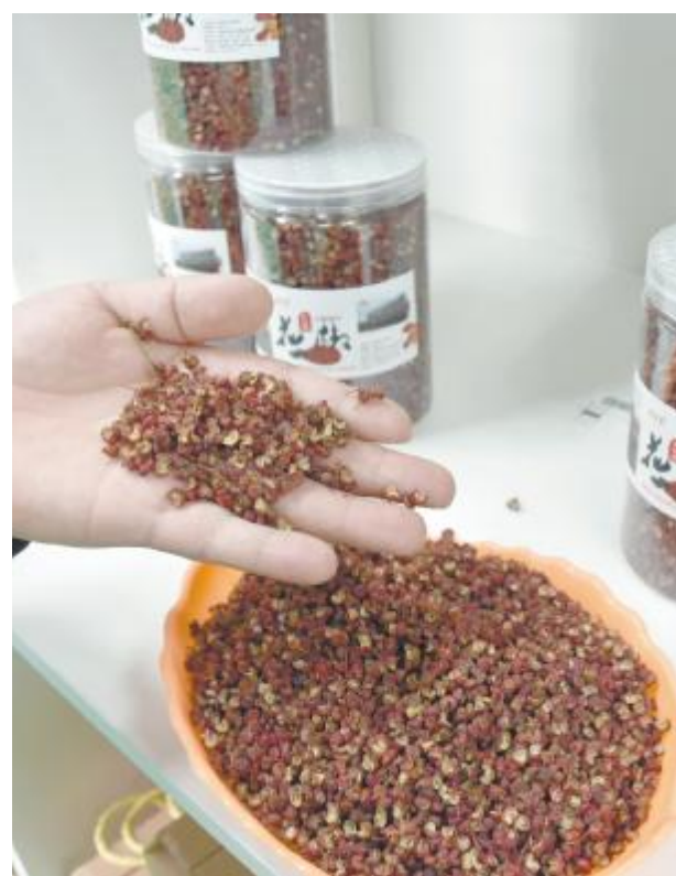
颗粒饱满、色泽红艳的花椒