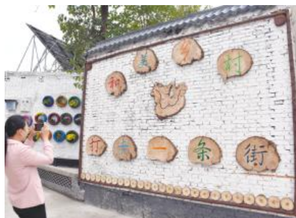
大峪镇范庄村的特色展示墙