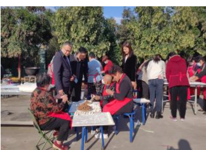
重阳节为老年人包饺子