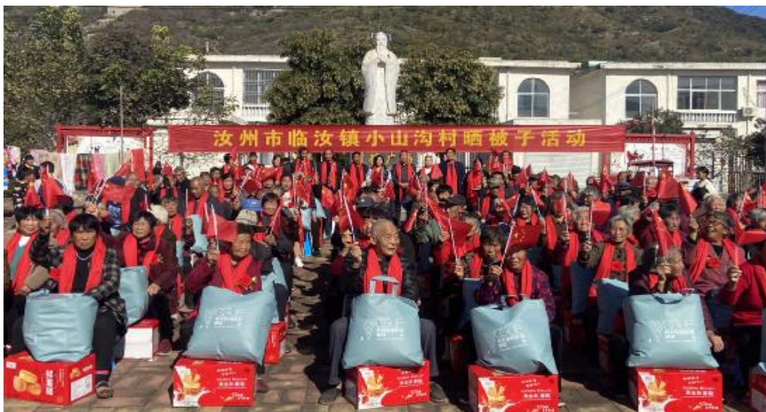
临汝镇小山沟村用被子晒孝心