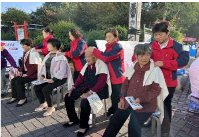
志愿者为老年人义务理发