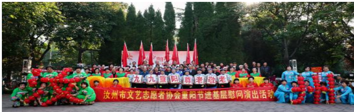
精彩的文艺演出

现场还举行表彰活动,为好婆婆、好媳妇、优秀教师、学习强国标兵、优秀党员等代表颁发荣誉证书和奖品,并为本村70岁以上老人发放礼品。活动中,还邀请市曲剧团送来精彩的戏曲演出,营造了祥和欢乐的节日氛围。