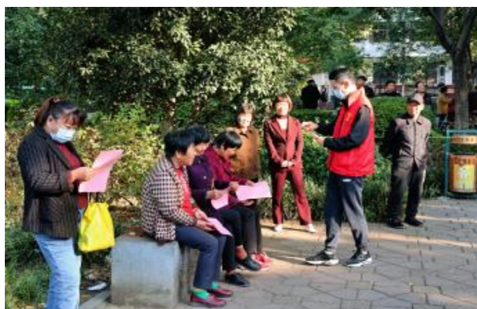
为中老年人普及防诈骗知识