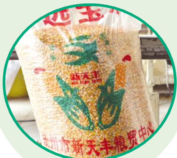
要出售的成袋商品