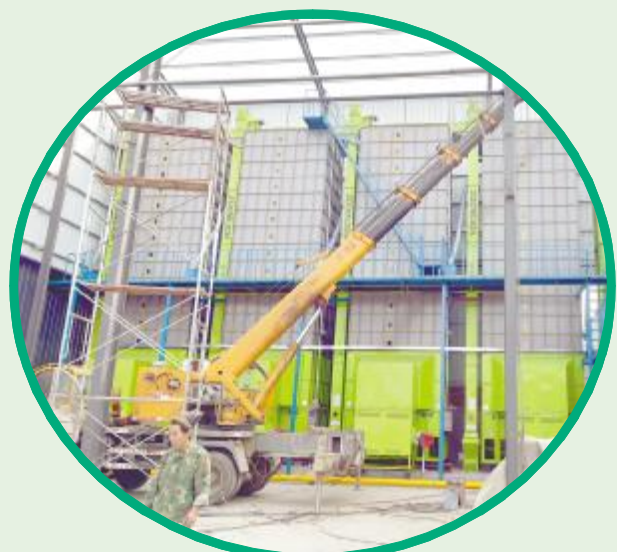
胡继农新建四台大型烘干设备