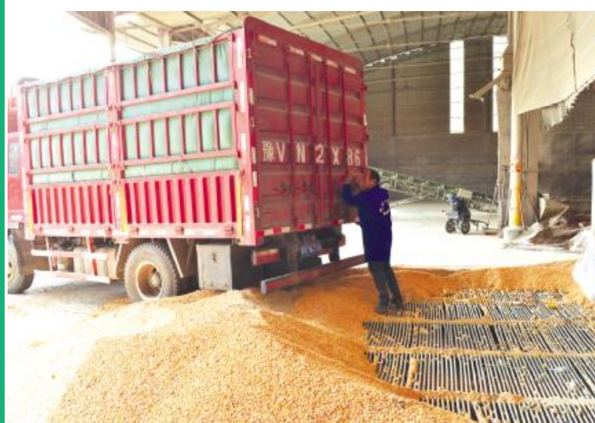
工人正在开箱卸粮