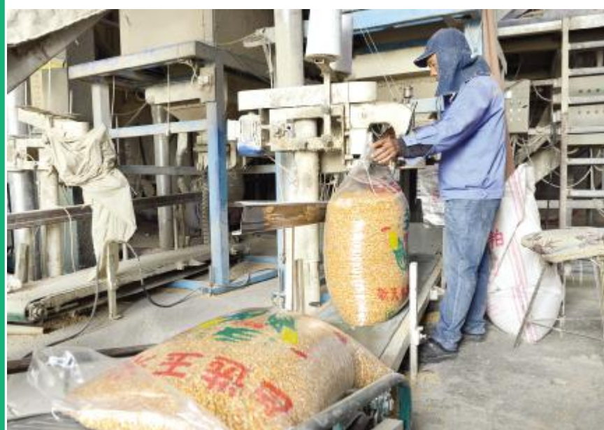
净化后的玉米装袋