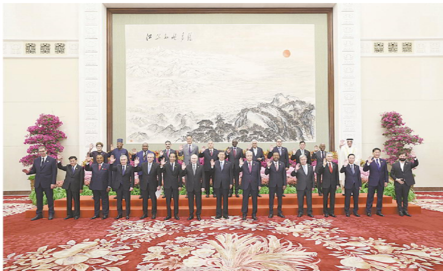
10月18日上午,国家主席习近平在北京人民大会堂出席第三届“一带一路”国际合作高峰论坛开幕式并发表题为《建设开放包容、互联互通、共同发展的世界》的主旨演讲。这是会前,习近平同出席高峰论坛的外国国家元首、政府首脑和国际组织负责人等国际贵宾集体合影。

新华社北京10月18日电 (记者 涂铭 孙奕) 10月18日上午,国家主席习近平在人民大会堂出席第三届“一带一路”国际合作高峰论坛开幕式并发表题为《建设开放包容、互联互通、共同发展的世界》的主旨演讲。习近平宣布中国支持高质量共建“一带一路”的八项行动,强调中方愿同各方深化“一带一路”合作伙伴关系,推动共建“一带一路”进入高质量发展的新阶段,为实现世界各国的现代化作出不懈努力。 金秋时节,天高气爽,风清气朗。天安门广场