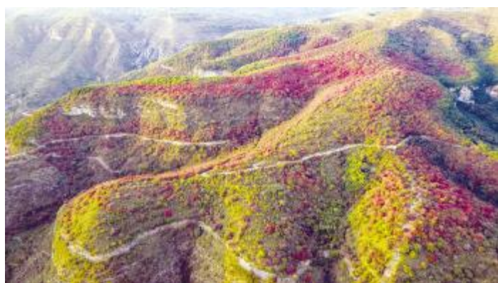
漫山红叶装点秋色