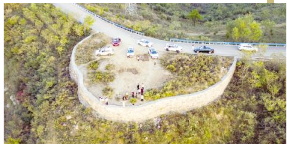
仙人掌红叶观景台

二、中西部观赏区：大峪村（或者林桐高速公路大峪出口下）——沿新马线西行1公里转入岔道——大泉火石沟（赏红叶）——返至乡道沿乡道至雷泉关顶山（看红叶和古村落）。大峪村（或林桐高速大峪出口下）——沿新马线西行——王台（赏红叶）——高岭村（赏红叶）。