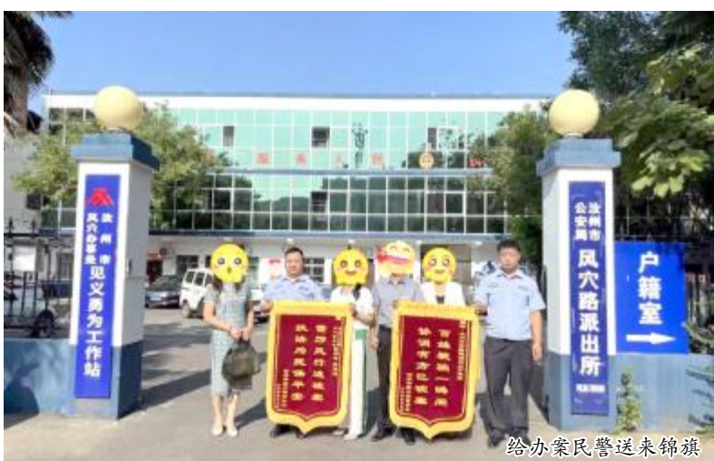
给办案民警送来锦旗

本报讯（融媒体中心记者 郭营战 通讯员 张少格）“当警察给我说时，我都不敢相信，原本想再也拿不回被骗的钱了，太感谢你们了！今后我一定向亲朋好友多宣传，谨防电信网络诈骗。”9月14日上午，风穴路街道辖区居民董女士将写有“雷厉风行速破案 执法为民保安安”和“百姓被骗一瞬间 协调有方已破案”字样的两面锦旗赠送给办案民警。