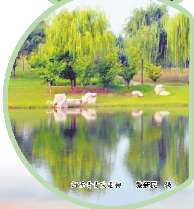
河面青青映垂柳