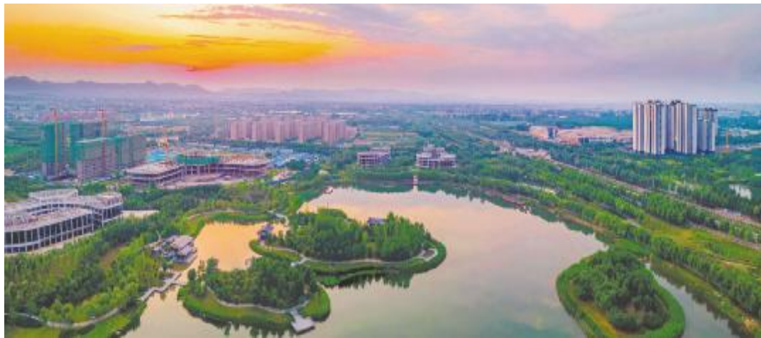
一水护城润民生