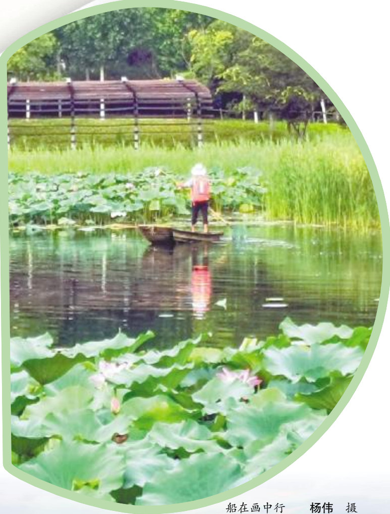
船在画中行