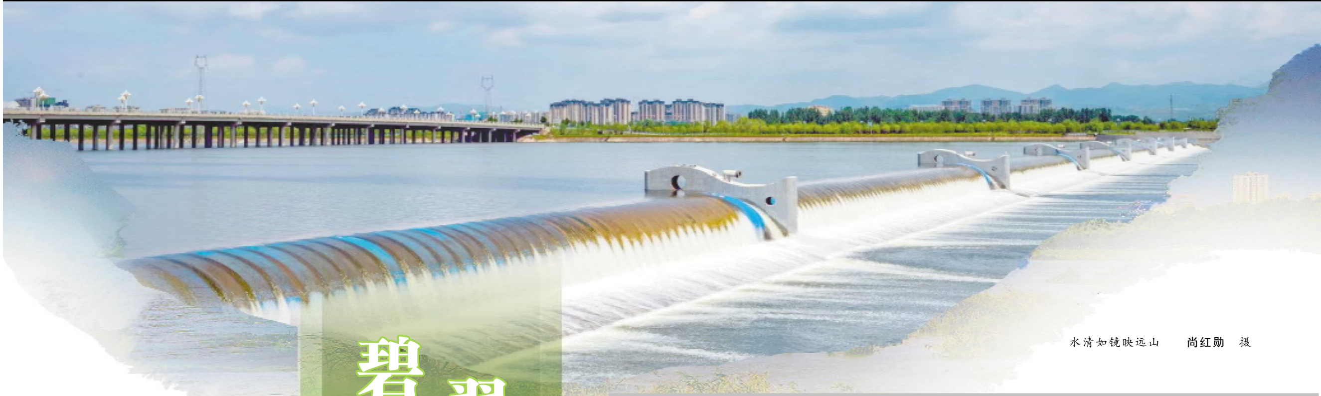
水清如镜映远山