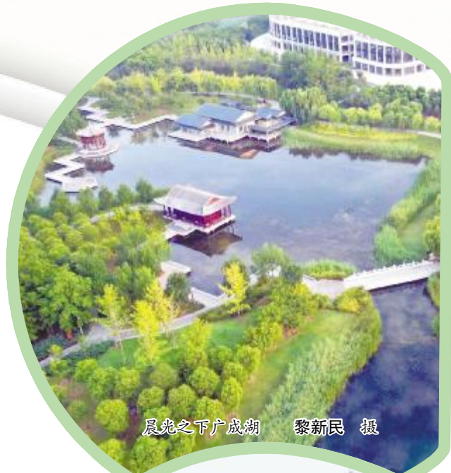
晨曦之下广成湖