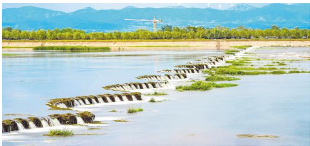
美丽北汝河 尚红勋 摄