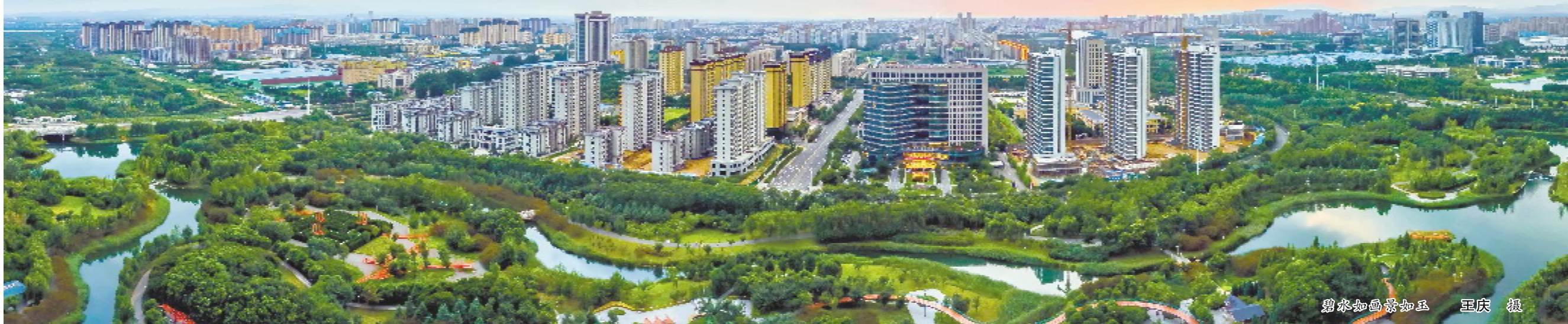
碧水如画景如玉