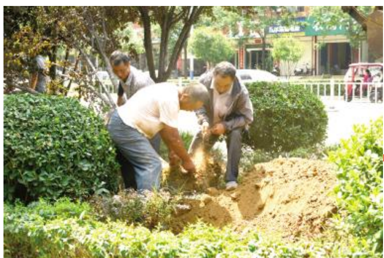
绿化工人补种绿植

入夏以来，全国多地进入“炙烤模式”。连日来，我市受到高温“烤”验。7月10日，市气象台发布高温橙色预警，我市最高气温将升至37℃以上。提醒政府相关部门按照职责落实防暑降温保障措施，缩短高温条件下作业人员连续工作时间，尽量避免户外作业，采取必要的防护措施，加强对老、弱、病、幼人群提供防暑降温指导。同时，注意防范因用电量过高，以及电线、变压器等电力负载过大而引发的火灾。