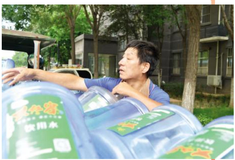
送水工一天送水量可达150桶