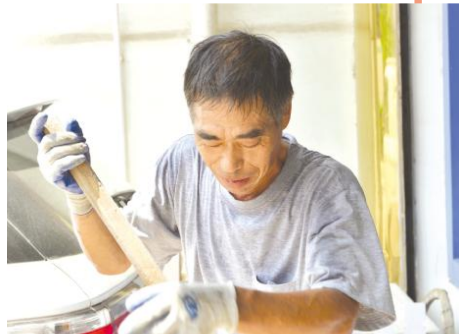
正在作业的建筑工人