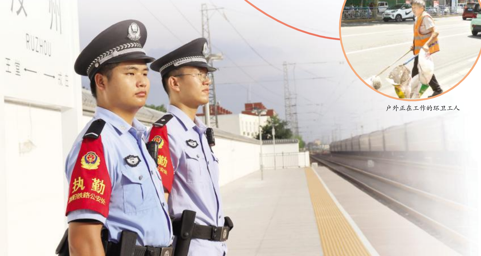
巡逻中铁路民警的汗水浸湿了制服