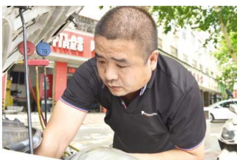
室外正在维修汽车的工人