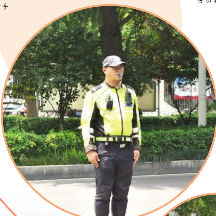
烈日下维持交通秩序的交通警