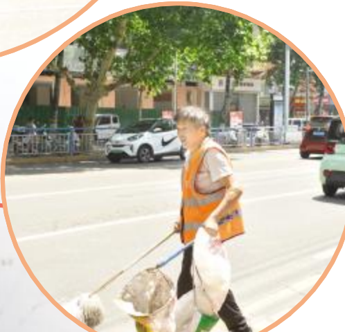
户外正在工作的环卫工人