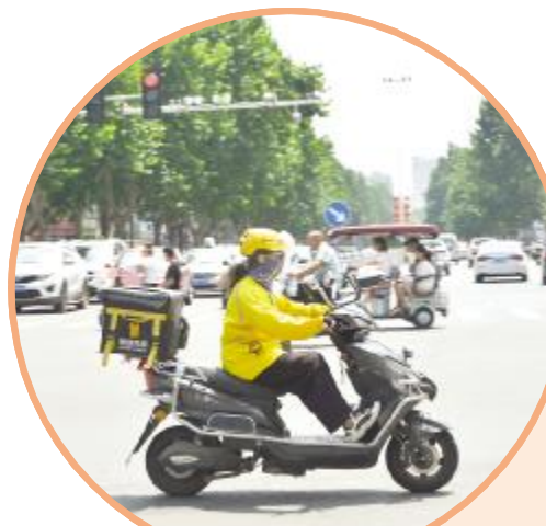
武装严实的外卖骑手