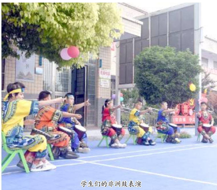
学生们的非洲鼓表演

“送温暖关爱文明实践，对特殊儿童进行健康心理、成长关爱，让这些接受特殊教育的孩子们充分感受到了来自大家家庭的温暖，教育他们在学校做个好学生，在社会做个好公民，争做新时代的好少年，将来成为祖国的有用之才。”市特殊教育学校负责人说。