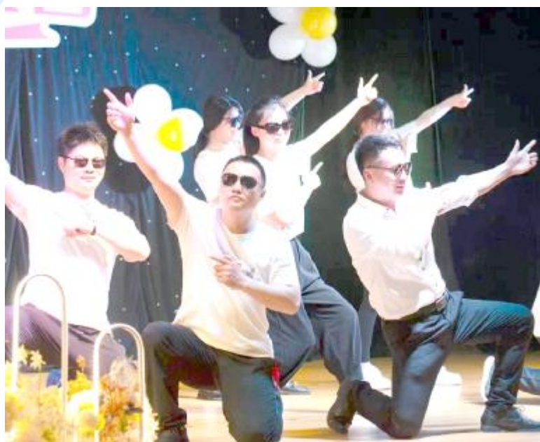
5月30日，为了庆祝“六一”，锦华幼儿园举办了一次别开生面的“六一”晚会，由家长表演节目，孩子们在台下观看。活动现场欢声笑语，气氛热烈。