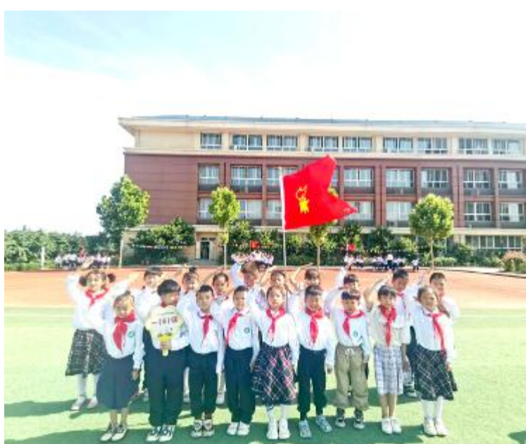
6月1日，儿童节当天，汝州市向阳小学锦绣校区举行一、二年级少先队入队仪式。

（上接第1版）新时代生态文明建设要从娃娃抓起，通过生动活泼的劳动体验课程，让孩子亲自动手、亲身体验、自我感悟，让“绿水青山就是金山银山”的理念早早植入孩子的心灵。