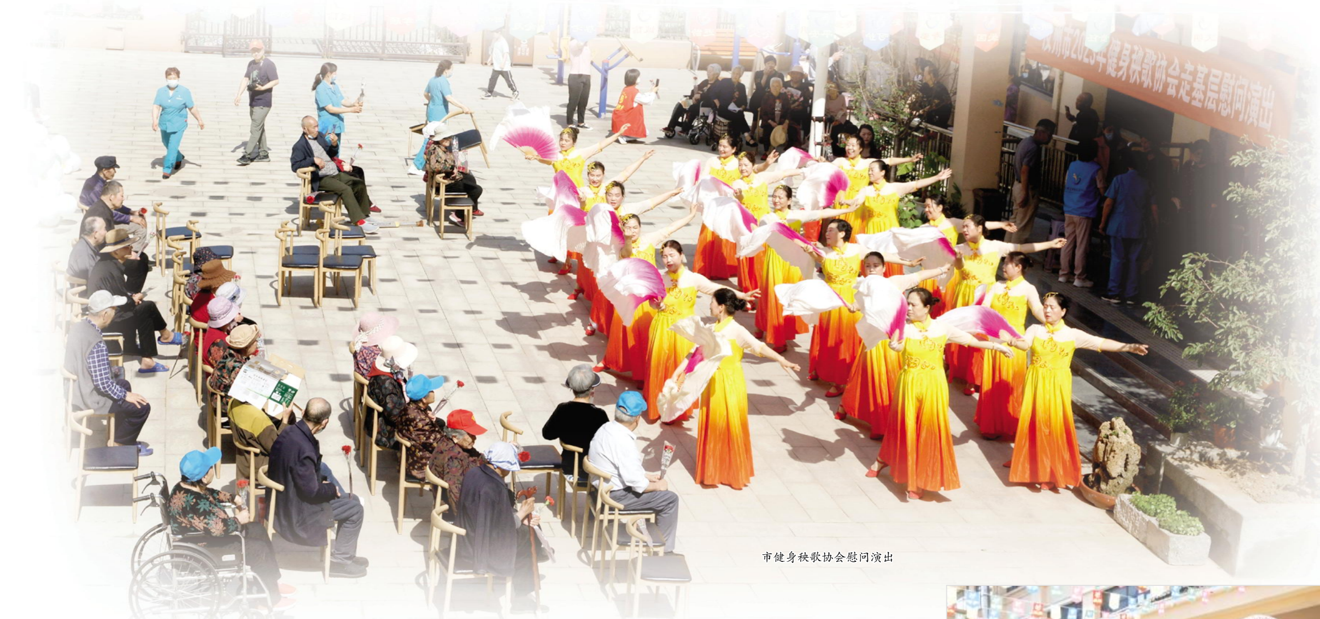
市健身秧歌协会慰问演出