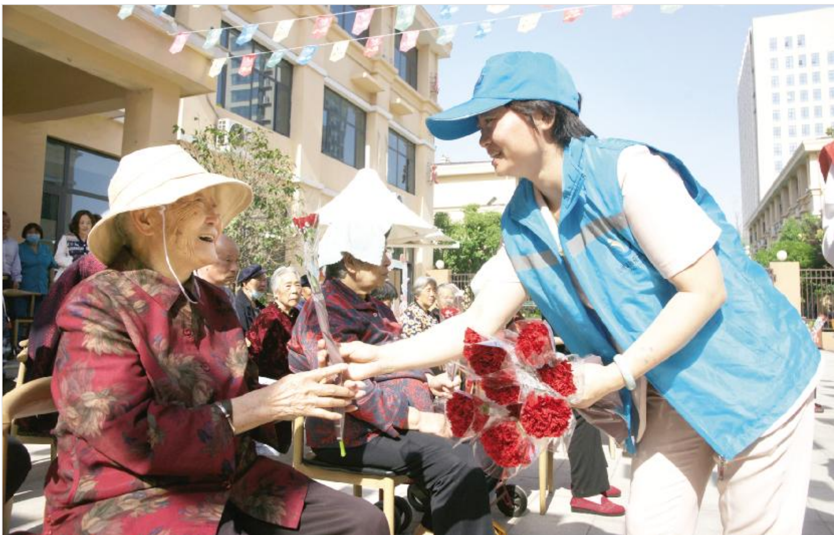
志愿者为老人送来康乃馨