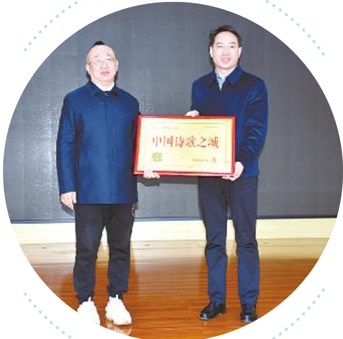
「中国诗歌之城」授牌仪式活动现场