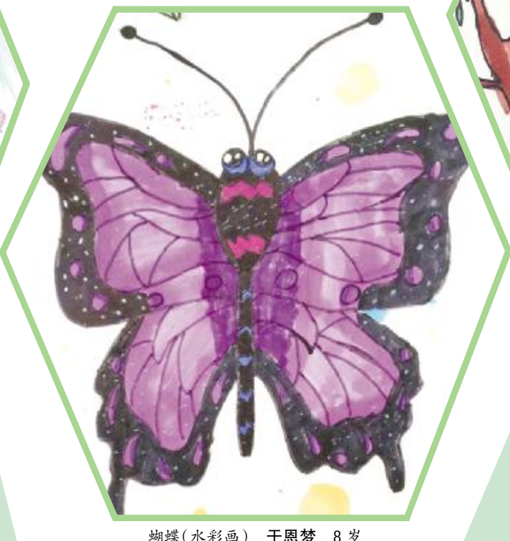
蝴蝶(水彩画) 于恩梦 8岁