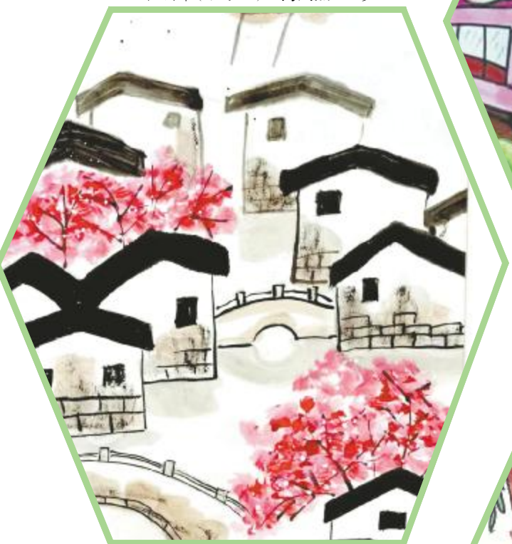
江南春色(国画) 卢峥 13岁