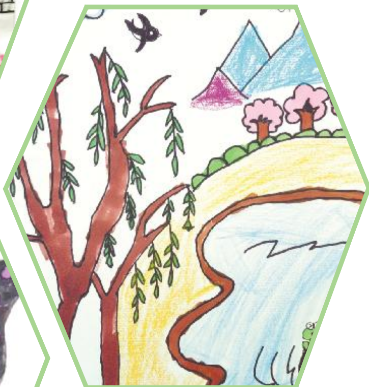
美丽春天(蜡笔画) 赵誉瑞 7岁