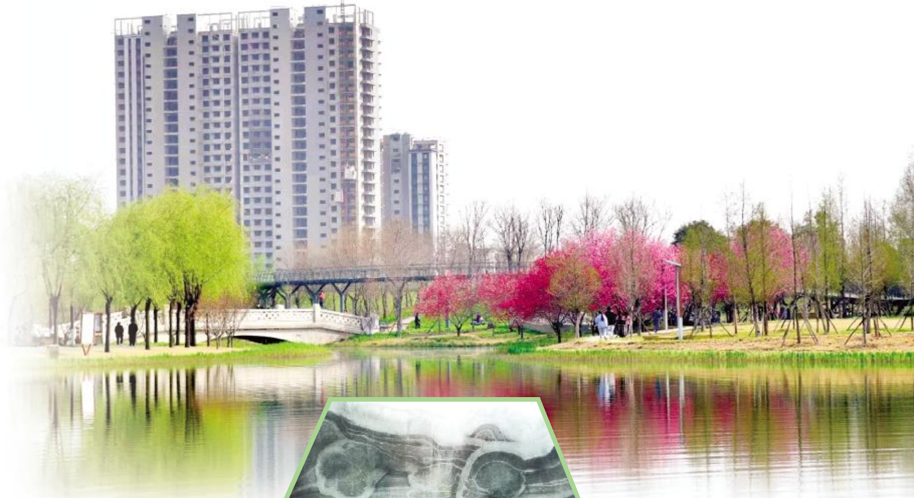
春到汝州

春天在哪里?春天在孩子们的眼睛里!在摄影师和小朋友笔下,春天是万物的复苏,是大自然的画板……今天,让我们一起通过画作、摄影、诗词等作品所带来的春日美好遐想,一起去拥抱春天、播种希望,感受春天吧!