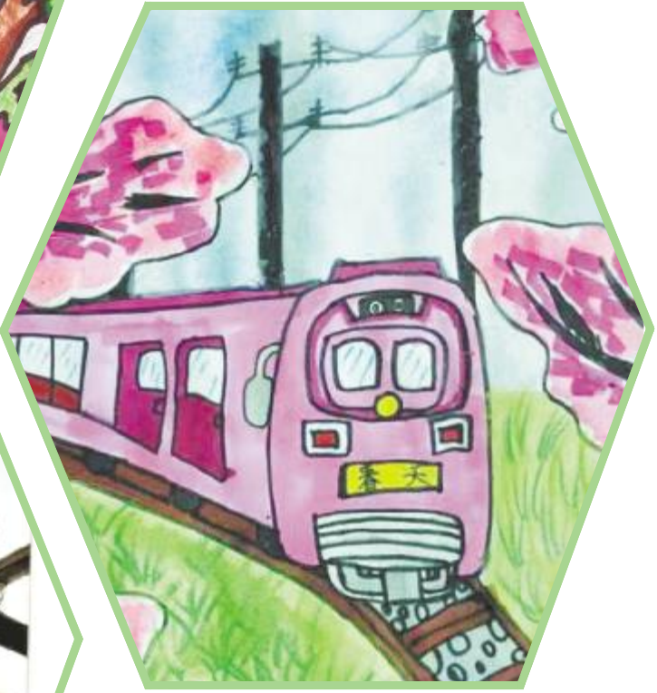
开往春天的列车(水彩画) 于恩梦 8岁