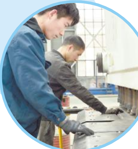
增强车辆有限公司工人在设备前作业