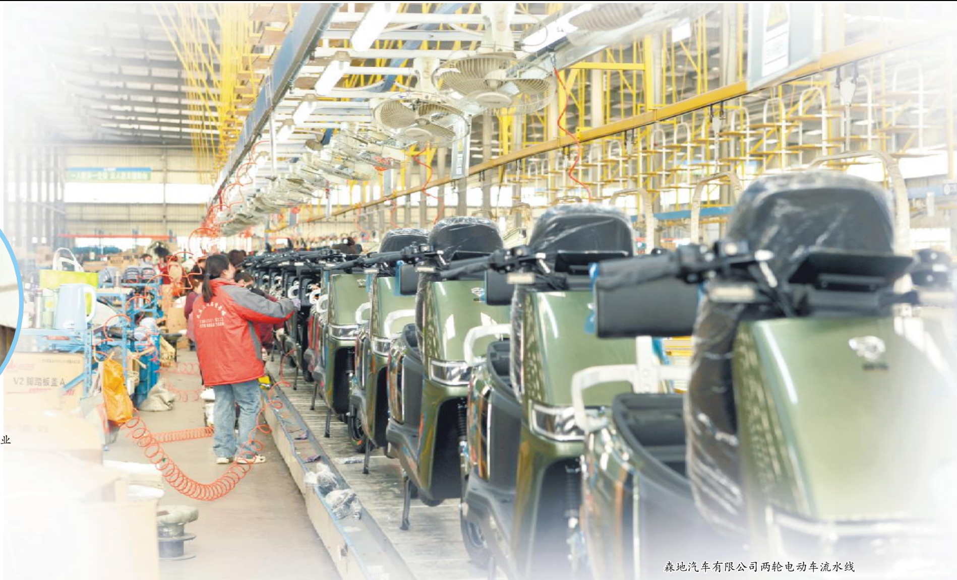
森地汽车有限公司两轮电动车流水线