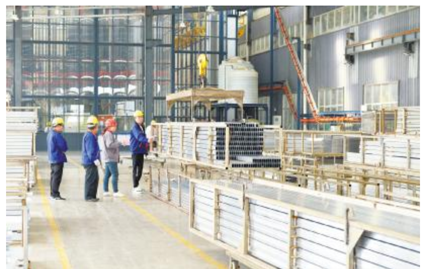
圣华原铝业生产车间内工人用全自动化设备搬运原材料