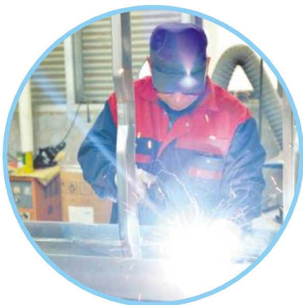
增强车辆有限公司工人正在焊接设备