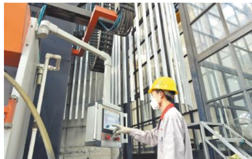
圣华原铝业新上线的全自动化生产线