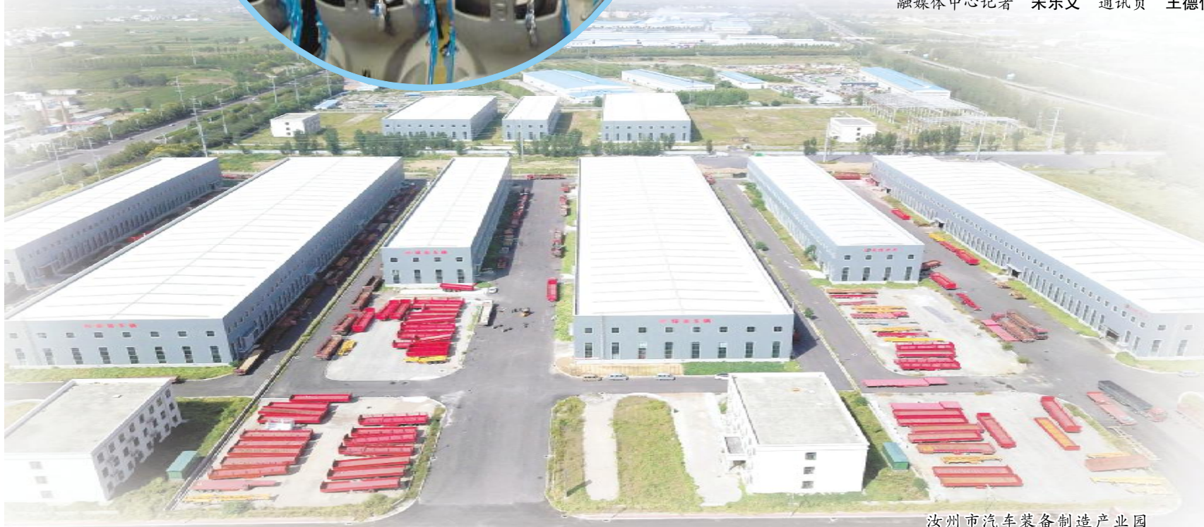
汝州市汽车装备制造产业园