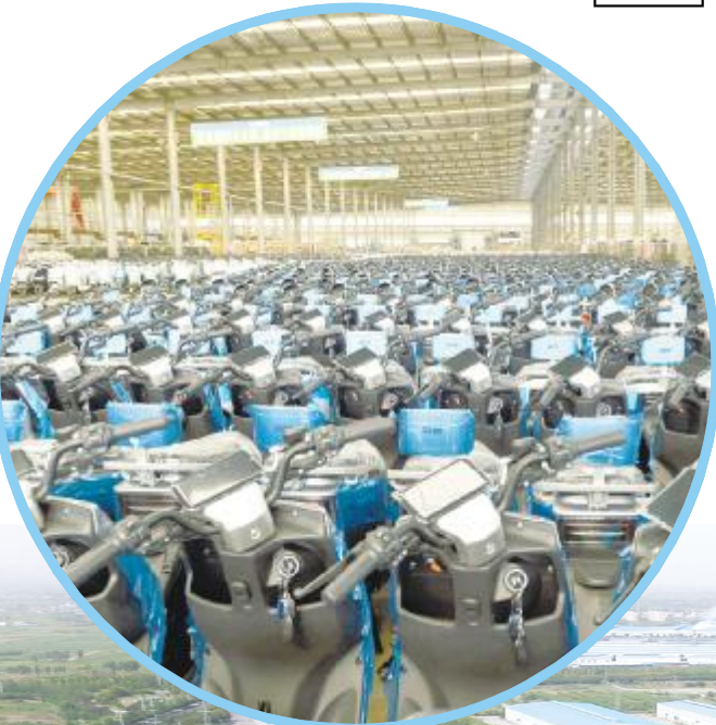
森地汽车有限公司生产的两轮电动车成品