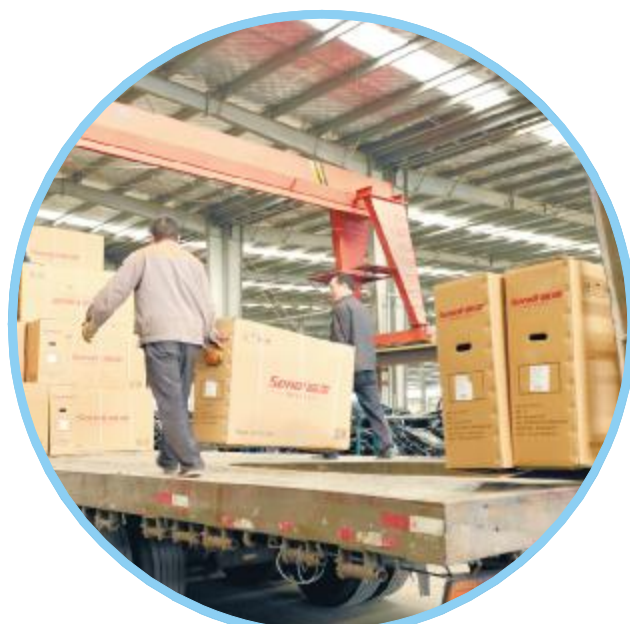
森地汽车有限公司工人正在将产品装车