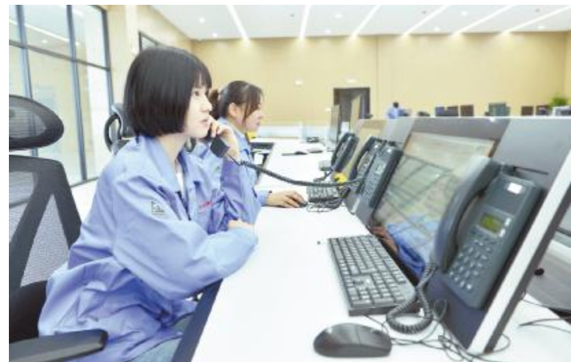
汝丰炭材料科技有限公司调度指挥中心