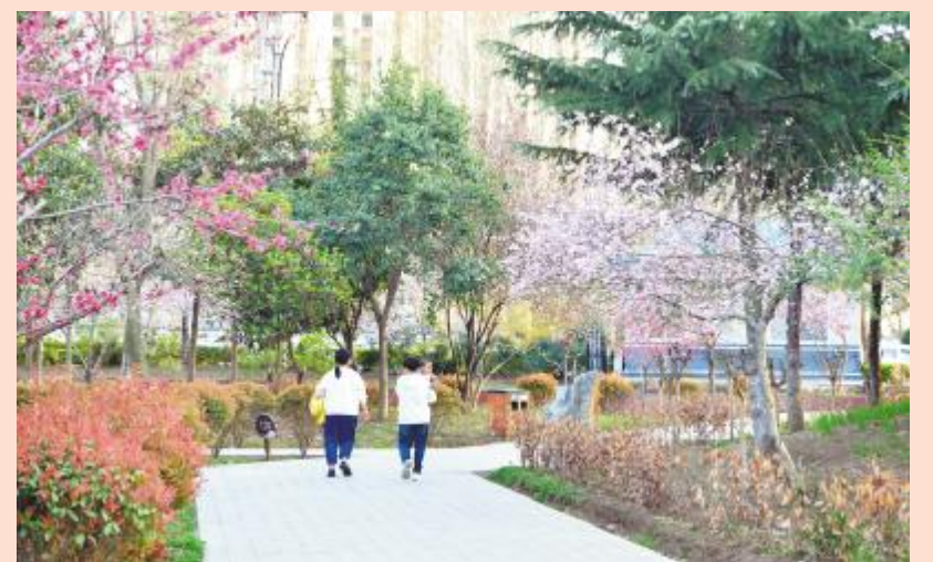
南关游园春色正盛