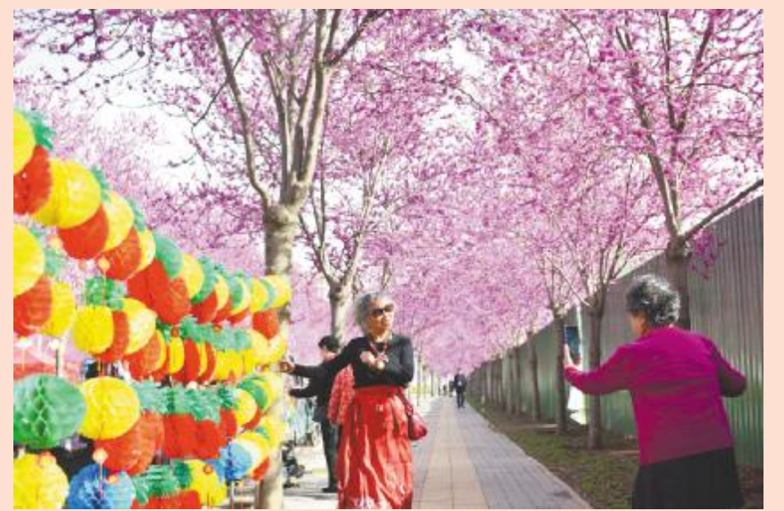
紫荆花节引来各地游客赏景打卡

小小一朵花,蕴藏大能量。“赏花经济”风起云涌,是“绿水青山就是金山银山”的生动诠释。从拔节生长的“赏花经济”中,我们可以窥见文旅市场的广阔前景。让我们巧做“花”文章,共赴“春日浪漫”,提升“赏花经济”颜值,增加“赏花经济”产值,以“花”经济打造出常开常新的“花”产业。