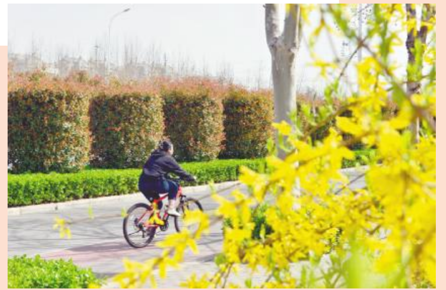
城市中央公园迎春花盛开,市民在春色里骑行