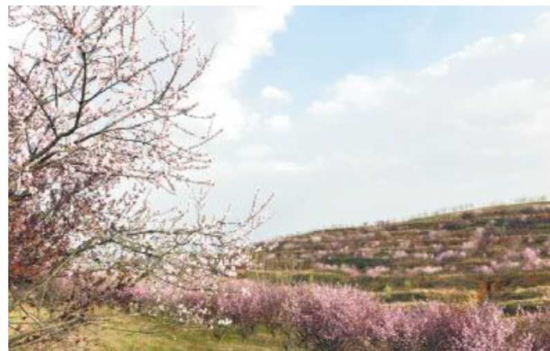
蟒川镇美人梅谷满山梅花迎春开