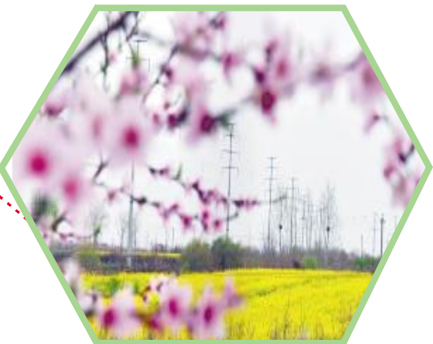
汝南街道田间桃花、油菜花竞相开放