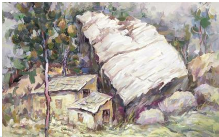
大峪女娲文化——滚石