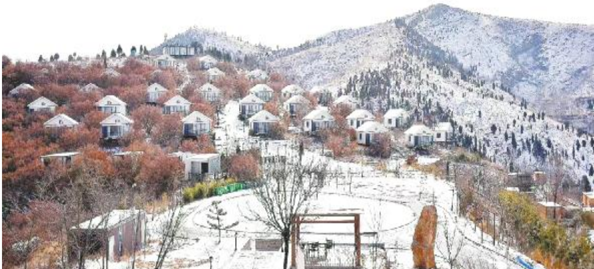
雪后初霁云堡妙境