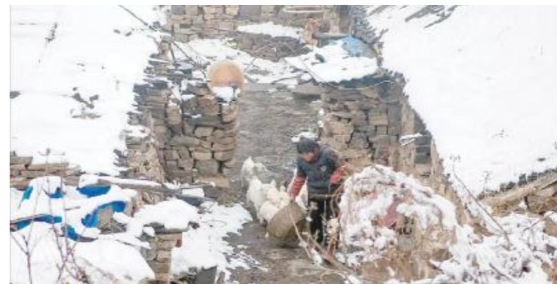
山乡生活