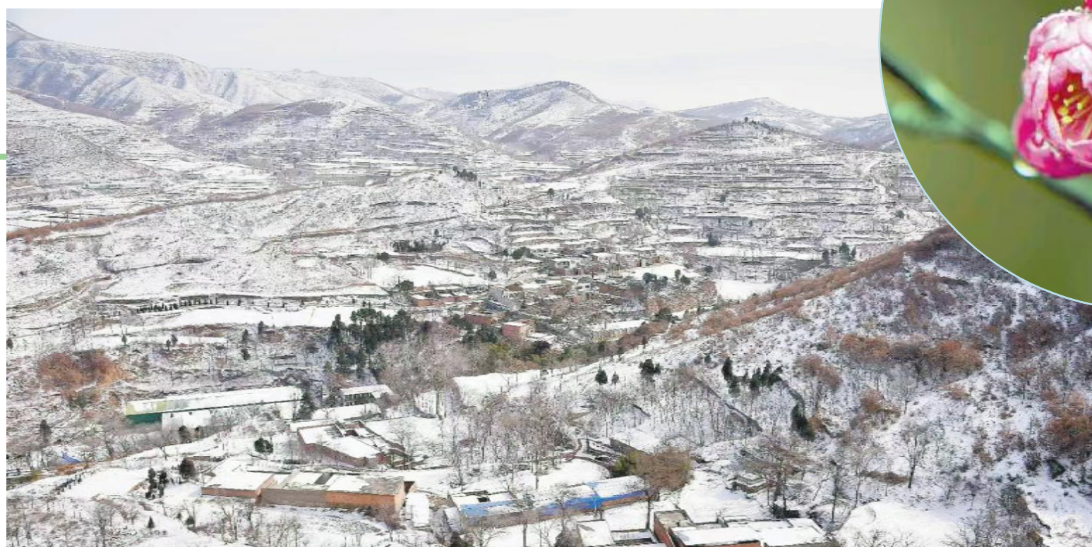
春雪润田野 韩晓东 摄