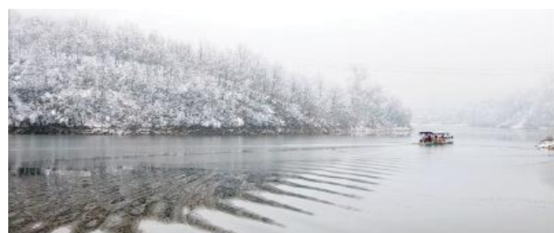
水墨山水九峰山