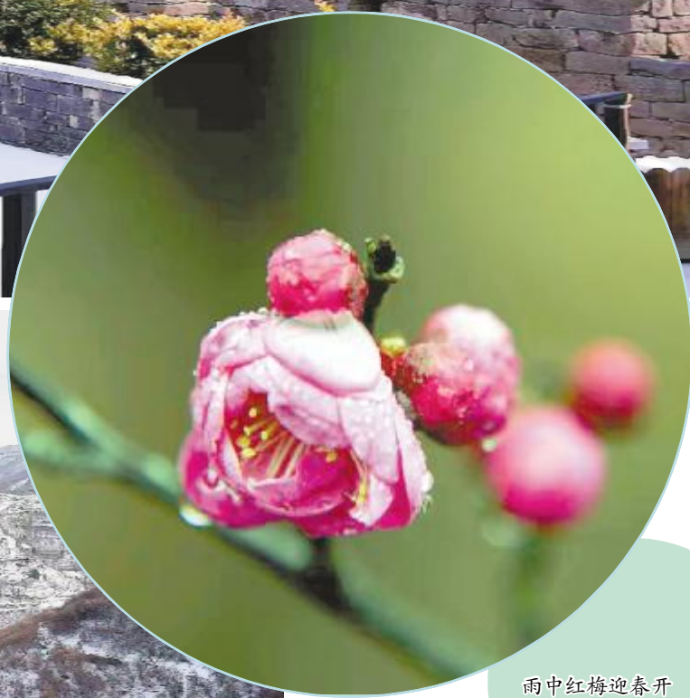
雨中红梅迎春开