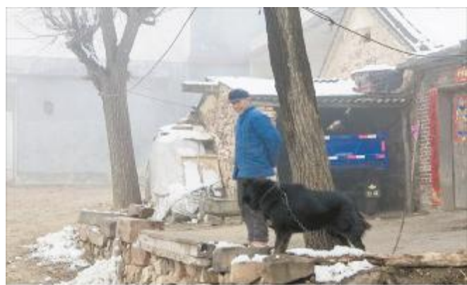
悠闲的老人

上周，细密的雨点和着漫天飘舞的雪花悄然而至，扬扬洒洒飞入春意融融的汝州城乡内外。