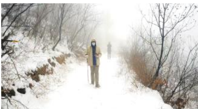
踏雪寻景