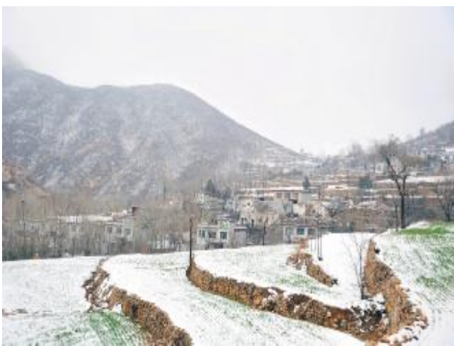
春雪润冬麦