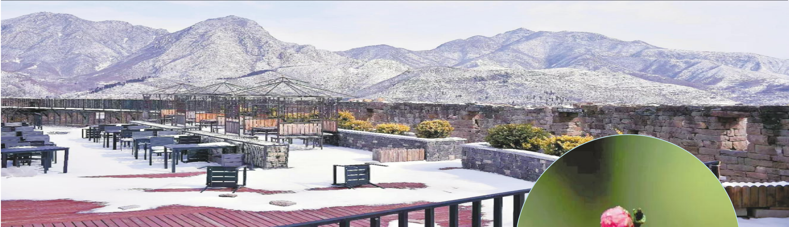
云堡妙境雪意浓