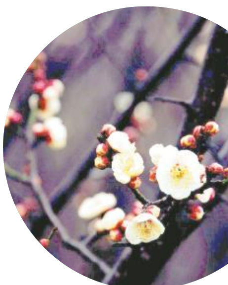
雨中春花更娇艳