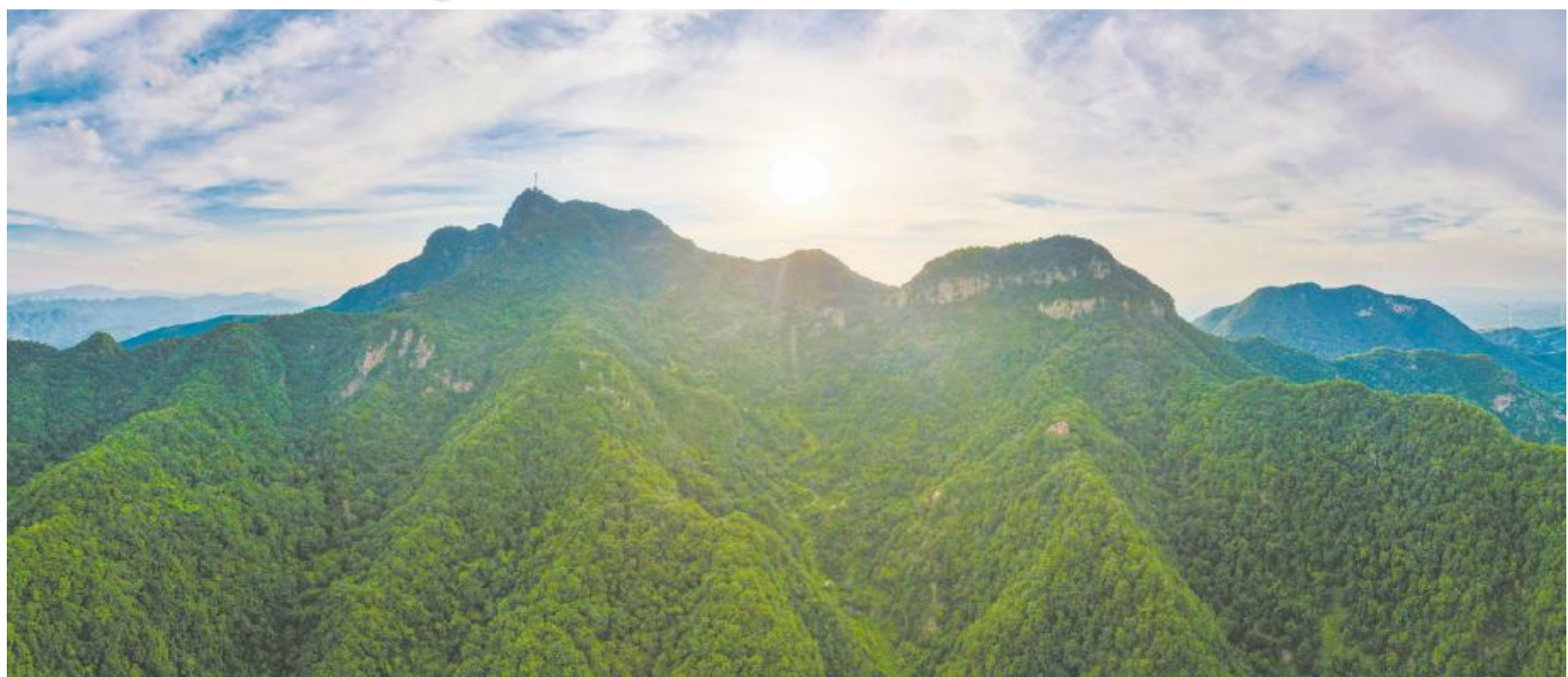
岷山叠翠，远黛如画