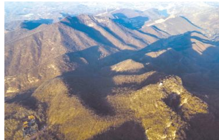
主峰西北侧是玉皇顶