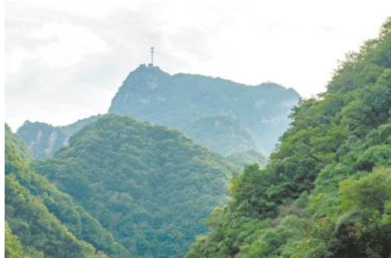
远观岷山山势巍峨