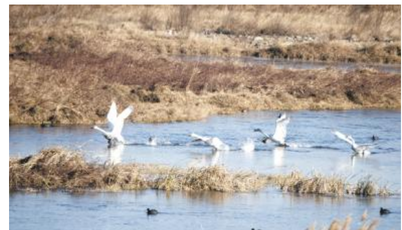
翩翩起舞