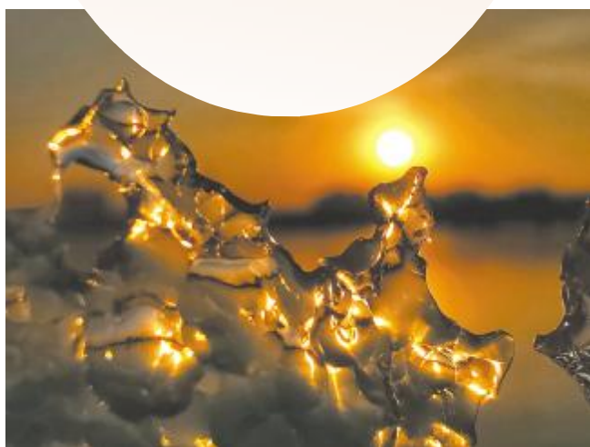
夕阳冰照