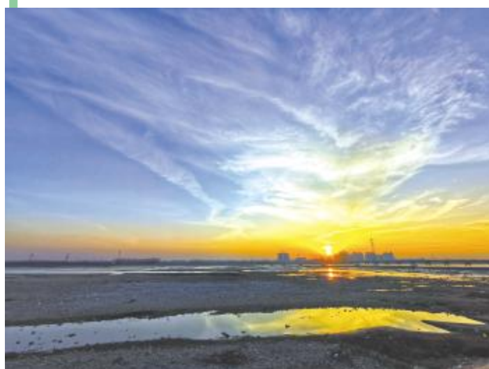
汝河夕照