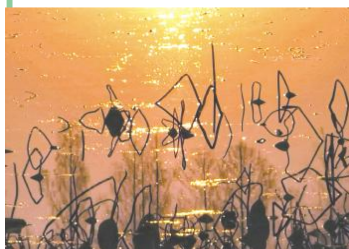
冬日音符

蓝天、落日、色彩斑斓的景致……冬日的汝州少了几许艳丽，多了几分静谧。此刻，无论是城市里还是乡野内外，风光无限好。 冬深时节，漫步中央公园、汝河湿地公园等处，让人心旷神怡。煦日暖阳下，色彩斑斓的树木与水系等相互交融，水面泛起浅浅微波，成群的白天鹅以及野鸭自由游弋其中，使得公园尽显温柔与平静。 在这个乍寒的季节，且让我们放下生活的繁琐，跟随摄影师的镜头，尽赏汝城内外冬日之美吧！