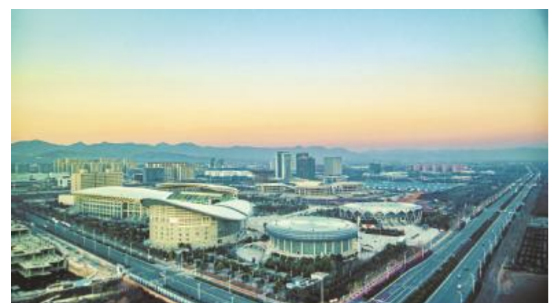
小城一隅

蓝天、落日、色彩斑斓的景致……冬日的汝州少了几许艳丽，多了几分静谧。此刻，无论是城市里还是乡野内外，风光无限好。 冬深时节，漫步中央公园、汝河湿地公园等处，让人心旷神怡。煦日暖阳下，色彩斑斓的树木与水系等相互交融，水面泛起浅浅微波，成群的白天鹅以及野鸭自由游弋其中，使得公园尽显温柔与平静。 在这个乍寒的季节，且让我们放下生活的繁琐，跟随摄影师的镜头，尽赏汝城内外冬日之美吧！