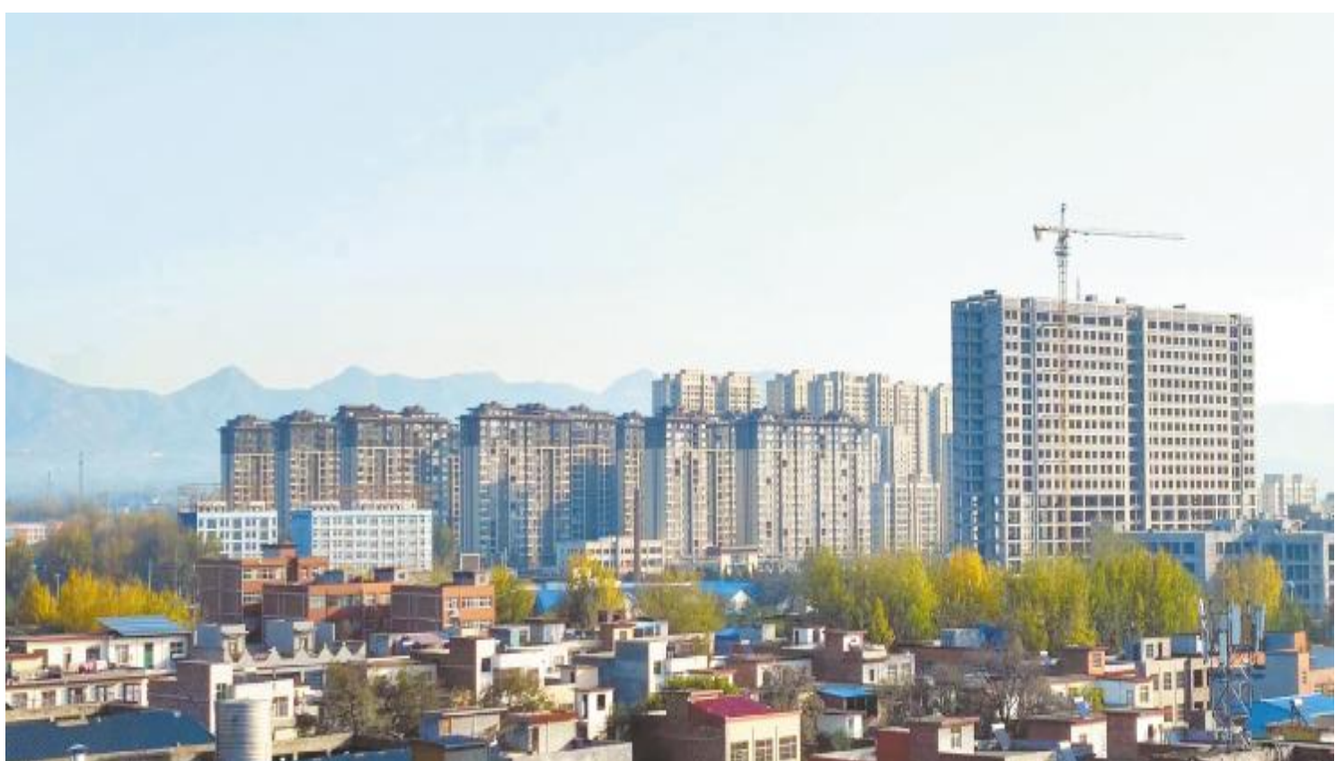
蒸蒸日上