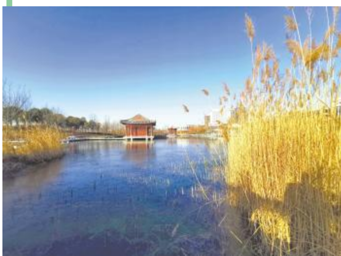
水天一色