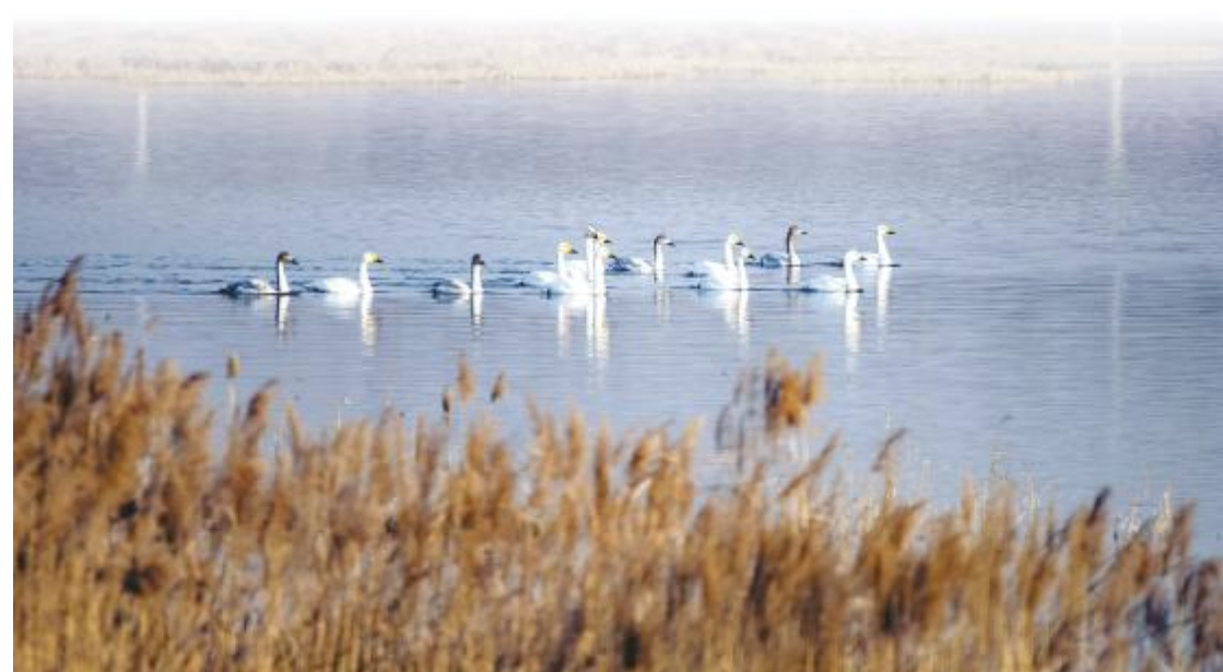
芳姿振翅朝寻食 薛楼安 摄