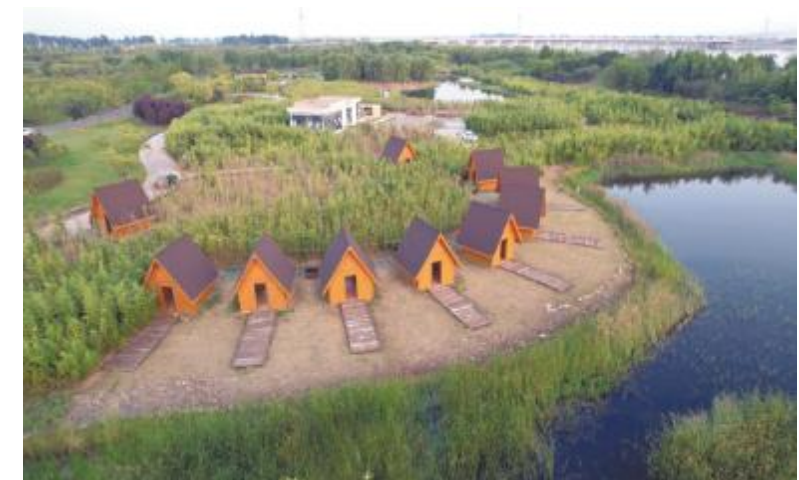
汝河湿地公园