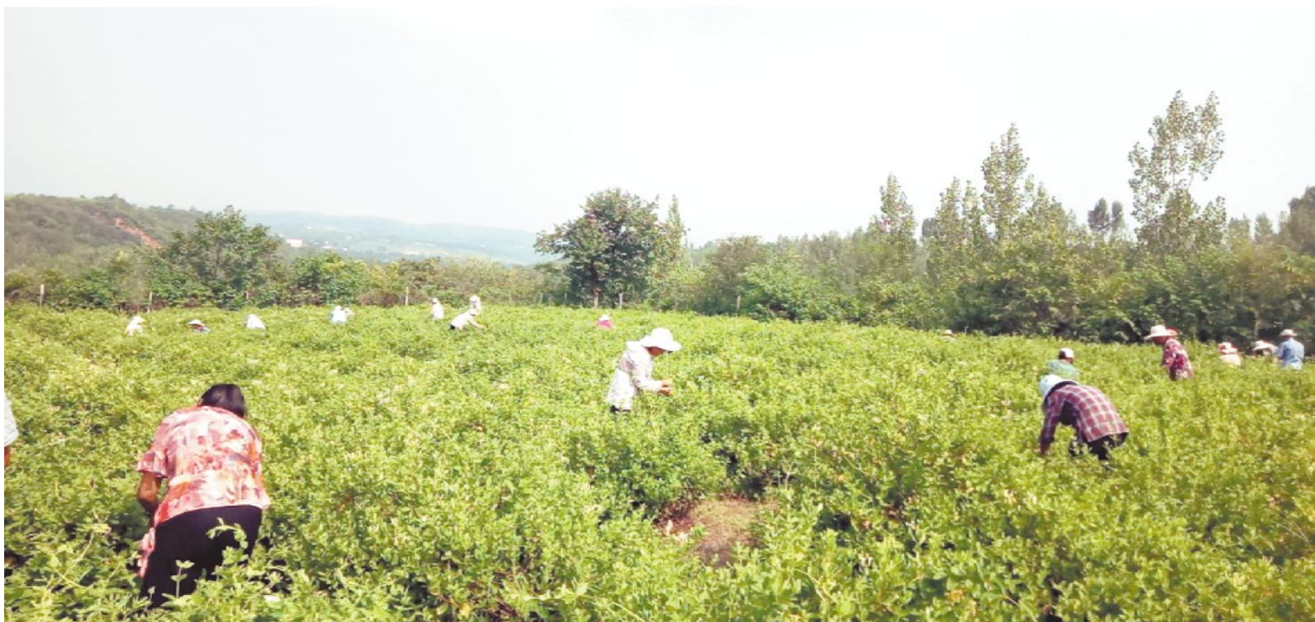
金银花喜获丰收,村民们忙着采摘。