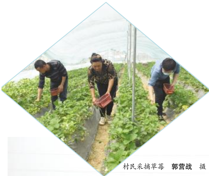
村民采摘草莓