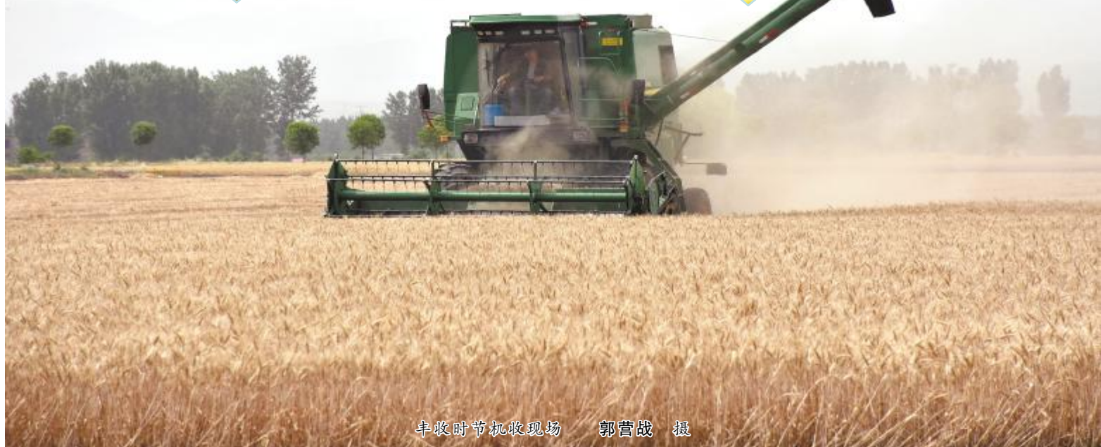
丰收时节机收现场