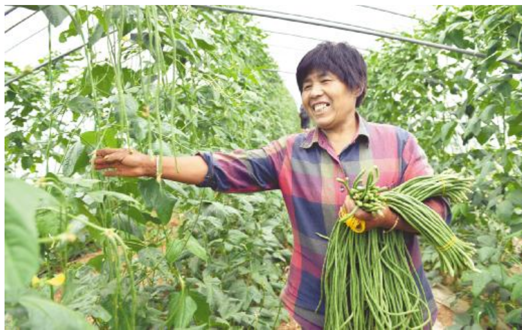
在夏店镇磨庄村,种植户流转100亩土地建设了11个大棚种植西瓜和豆角,当前一个棚能产将近2000斤豆角。

以寄料镇九峰山、蟒川镇碾平花海、温泉镇康养小镇、大峪镇云堡妙境、陵头镇王湾民宿等为基础,深入挖掘农业资源多重价值,围绕民俗