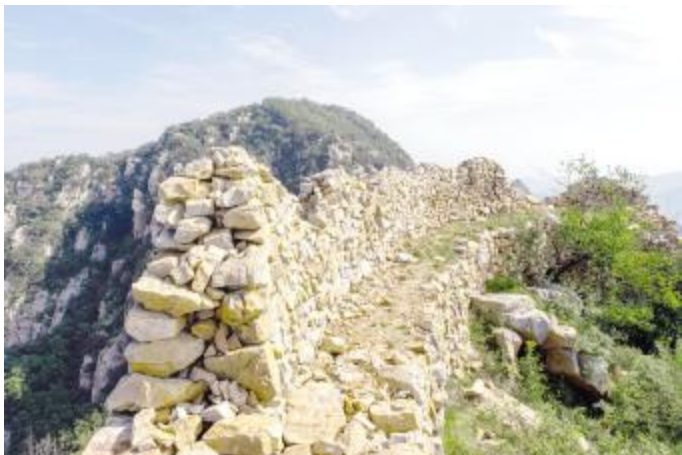
2米厚的寨墙上均有步道