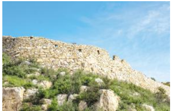
围墙依山势而建，遍布射击孔和瞭望口