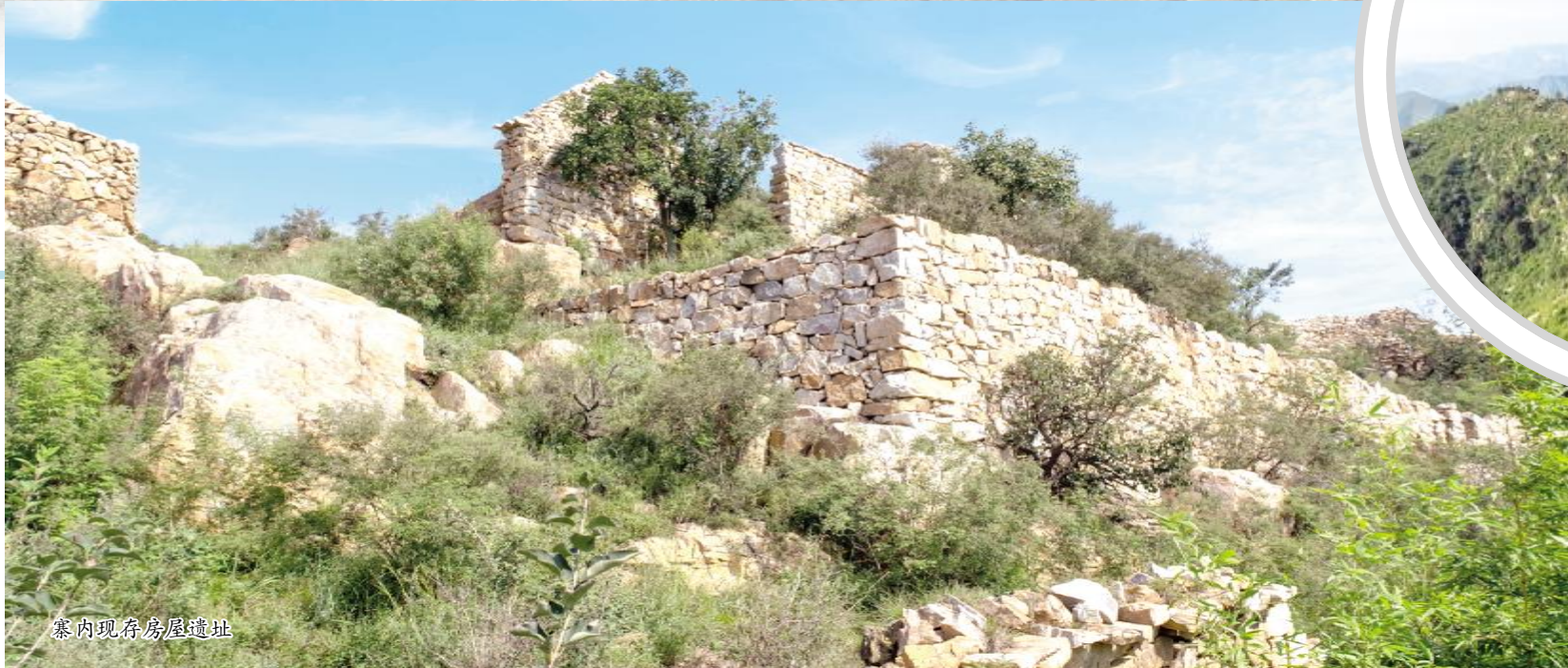
寨内现存房屋遗址