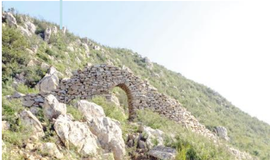
棉花寨的第一道寨门