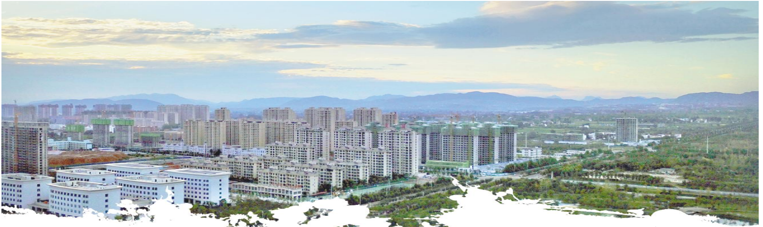
绿意环绕