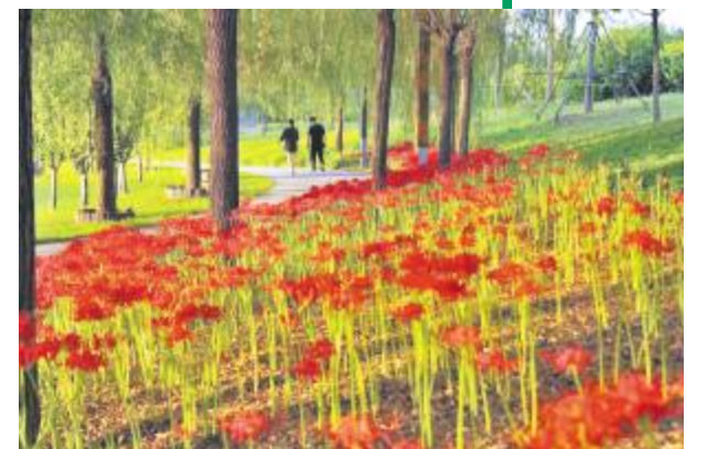
彼岸花开正艳