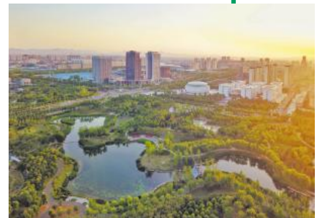
晨光下的市区

亲爱的朋友们,在这个美丽的季节,身边的美景令人心旷神怡。让我们停下匆匆的脚步,放松心情,走近我们美丽的汝州,畅享家乡初秋之美。