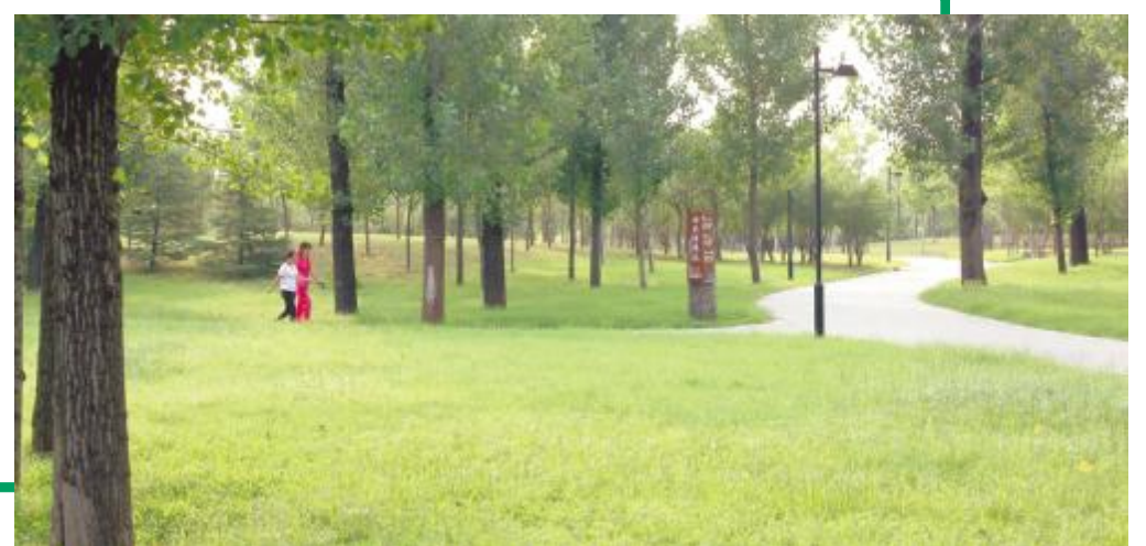
游园漫步