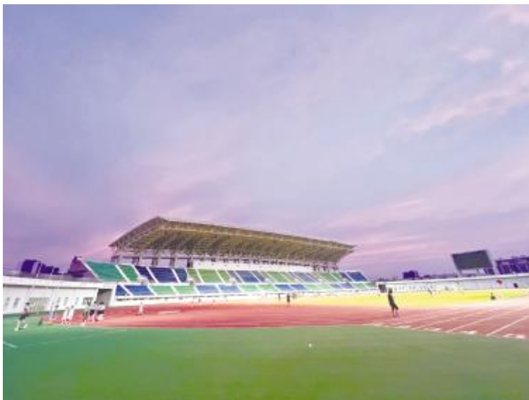
体育中心