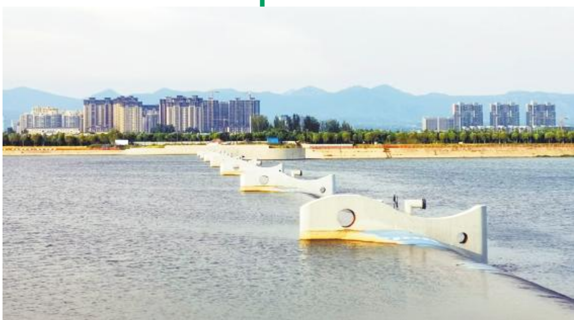
美丽汝河