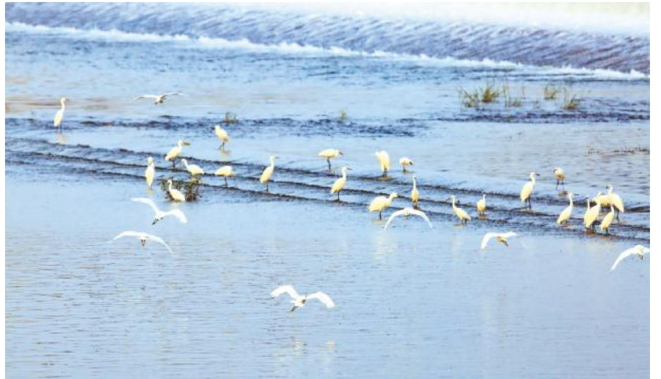
鸟儿翩跹