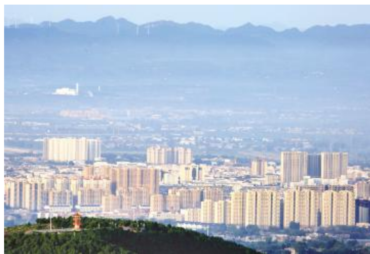
雨后的市区如水墨画中城