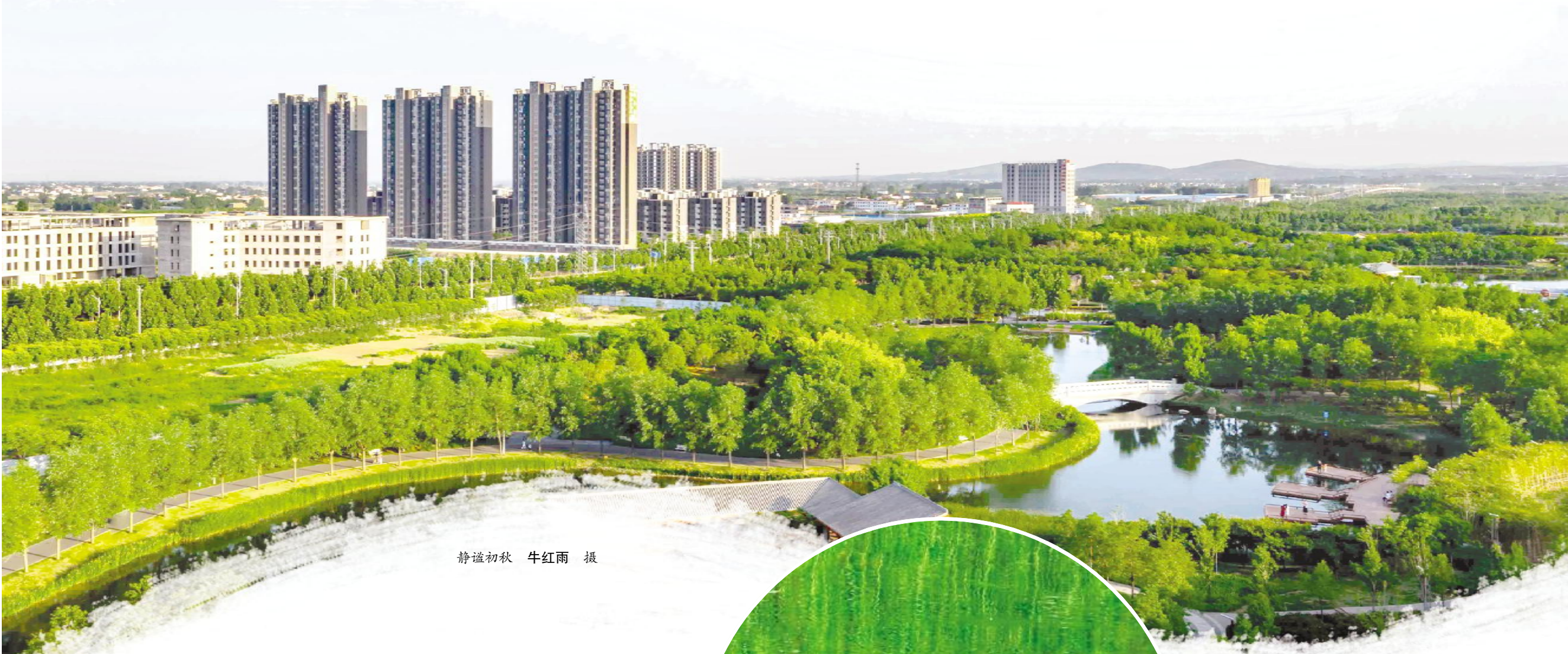
静谧初秋