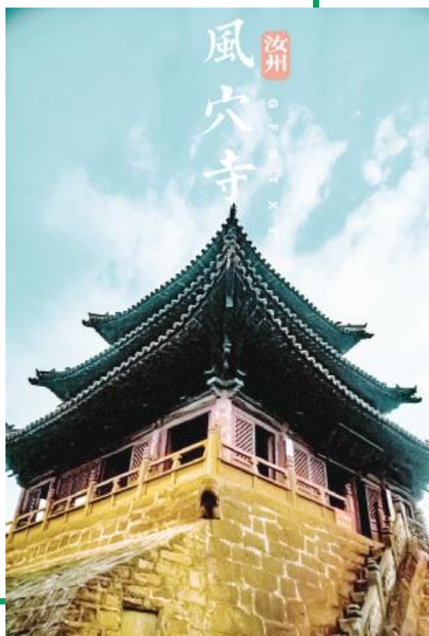
烟雨钟楼

流光容易把人抛，红了樱桃，绿了芭蕉。季节的更迭似乎总是在不经意间，仿佛昨日还是花开半夏，不觉今日就已浅秋微凉了。