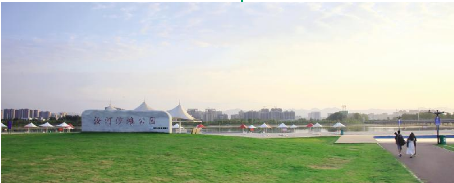
初秋汝河沙滩公园