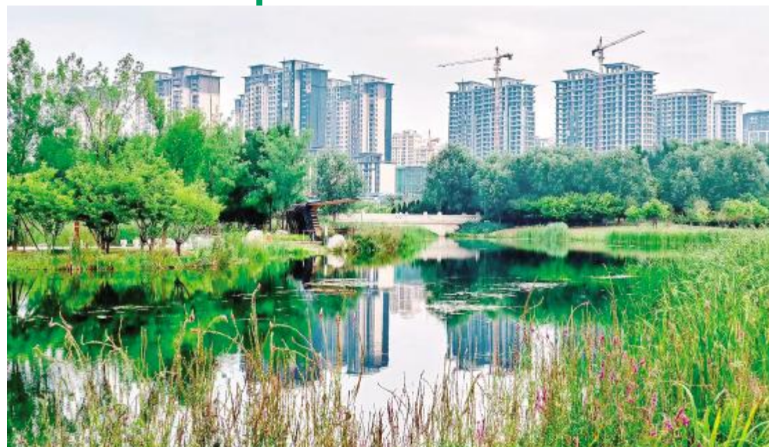
公园美景如画