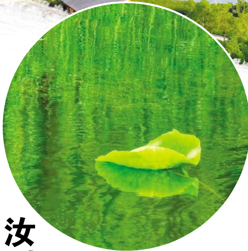
一叶知秋