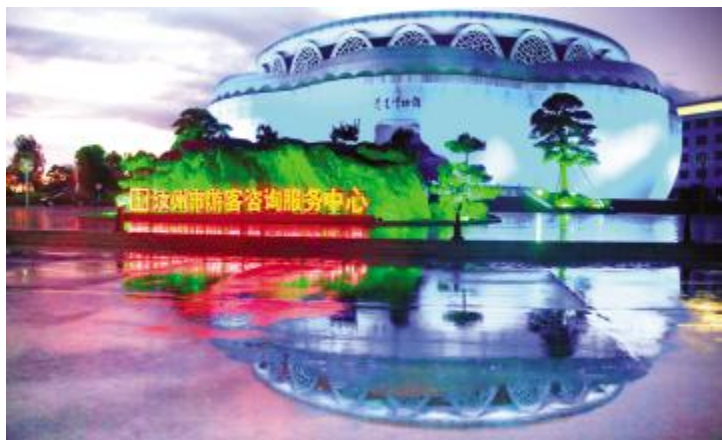
青瓷博物馆