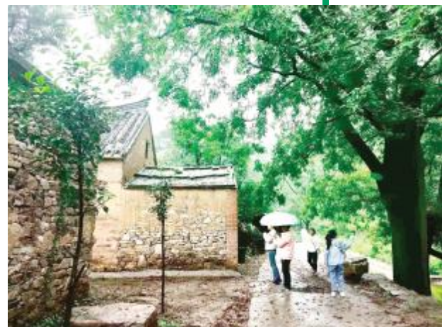
雨中游王湾村