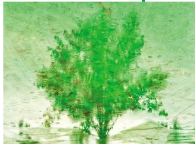
雨中倒影