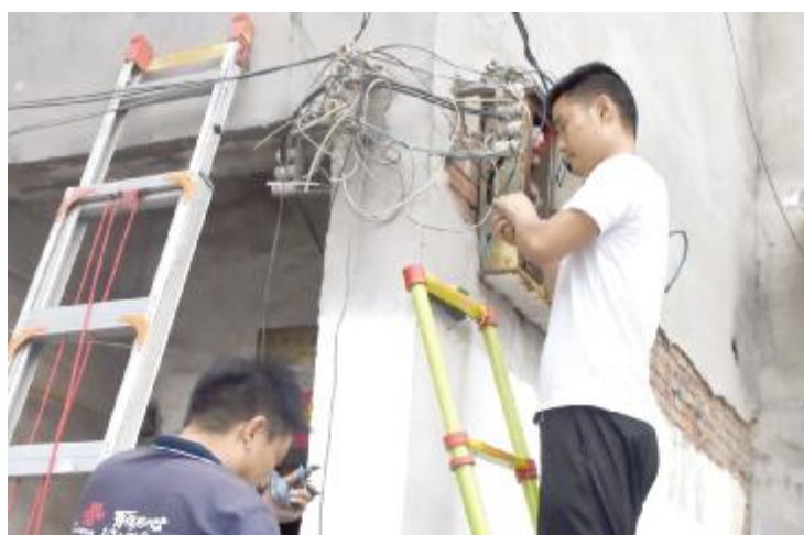
8月10日,通信公司的工作人员在玉带街整治杂乱线路,美化城市环境。

除了配置病菌消杀系统保证内部空气洁净外,社区核酸采样便民点还为核酸检测工作人员配备了空调和照明系统,为医护人员提供安全、舒适的工作环境。