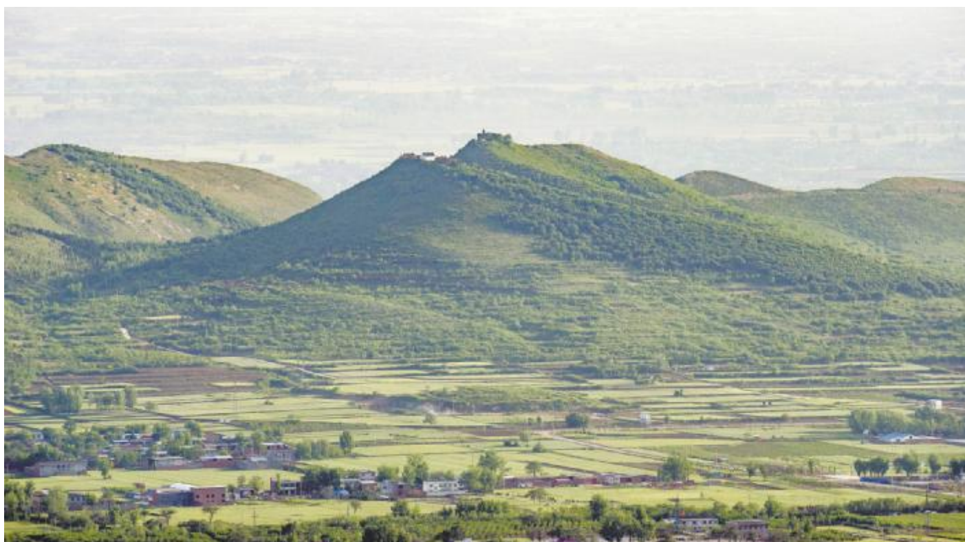
鹿台山西面的庇山