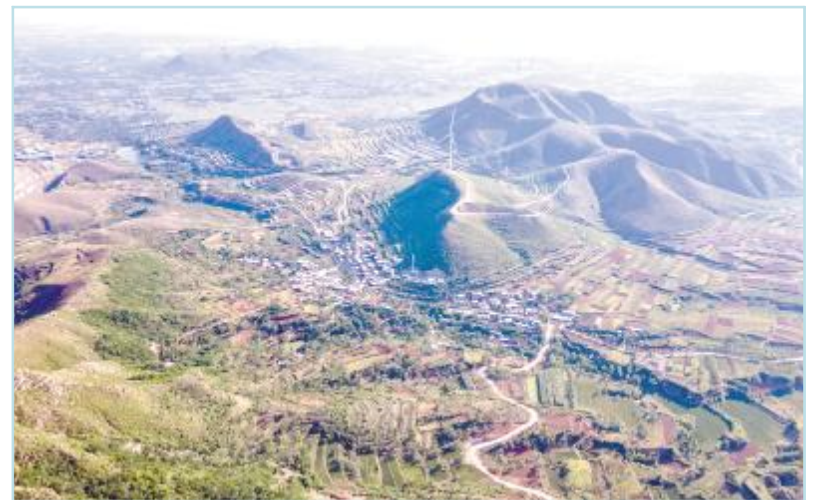
位于鹿台山西南侧的牛头山连绵起伏