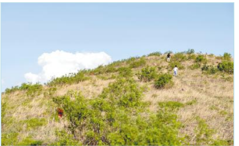
山路尽头是位于山顶的一个垭口