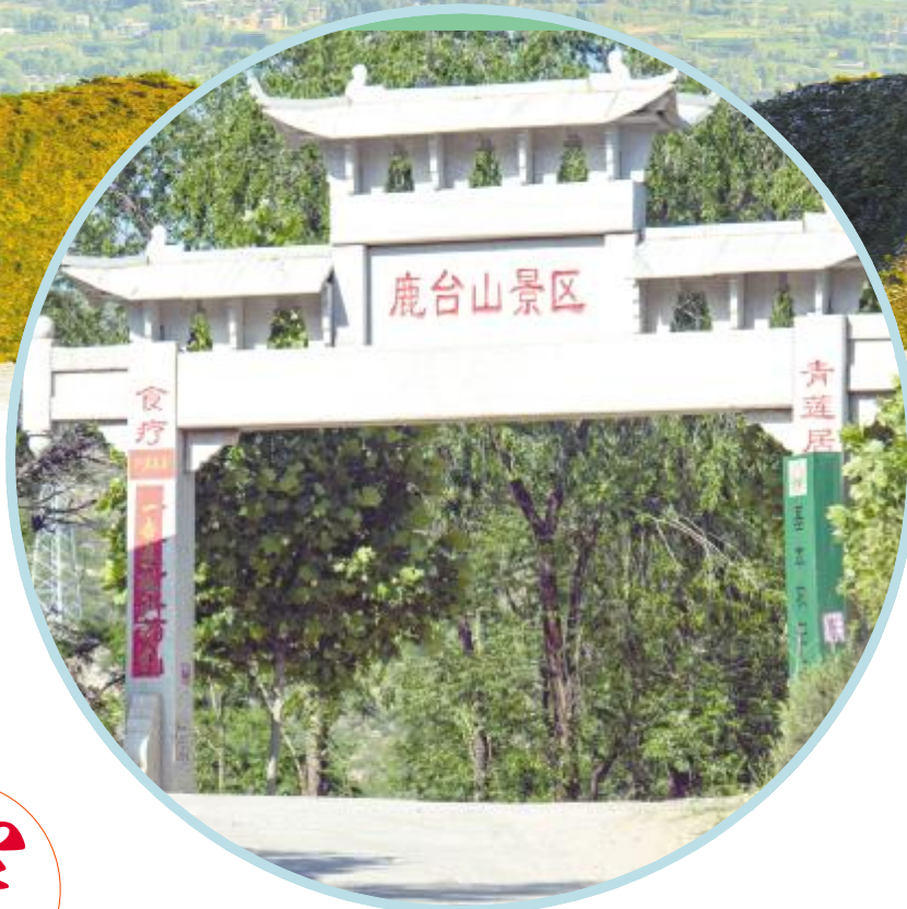
鹿台山景区石牌坊