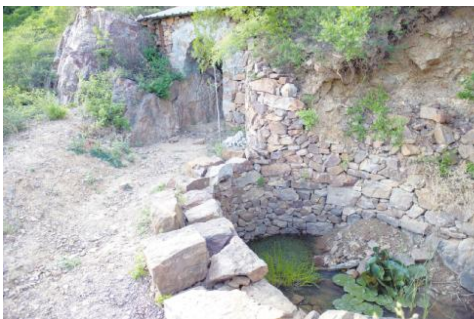
半山腰处简单的窑洞和小水塘