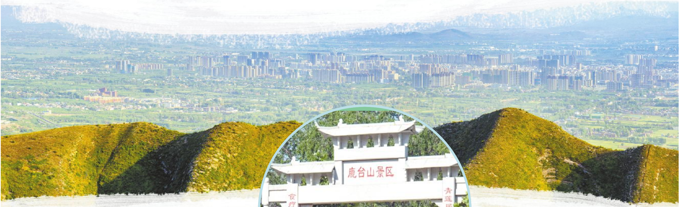
鹿台山右前方的牛筋巴山