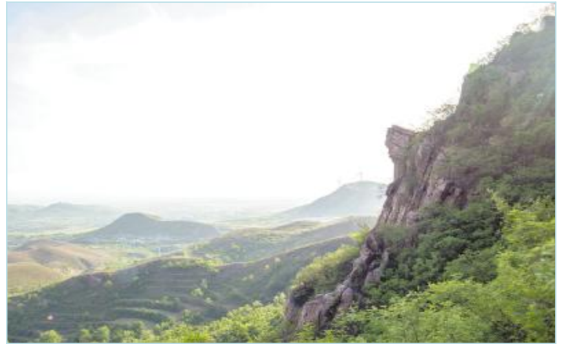
山内一块突出的岩石倚壁而立