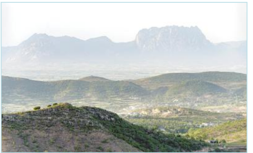
北边巍峨的少室山似在眼前