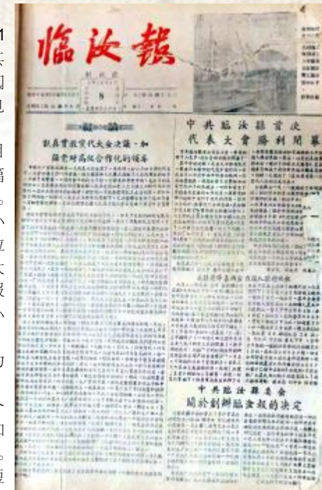
《临汝报》创刊号报样

《临汝报》由新闻、经济、政教、时事4个版块组成，分别介绍县内的工农业生产和文艺作品、时事政治等。辟有“经验介绍”“读者来