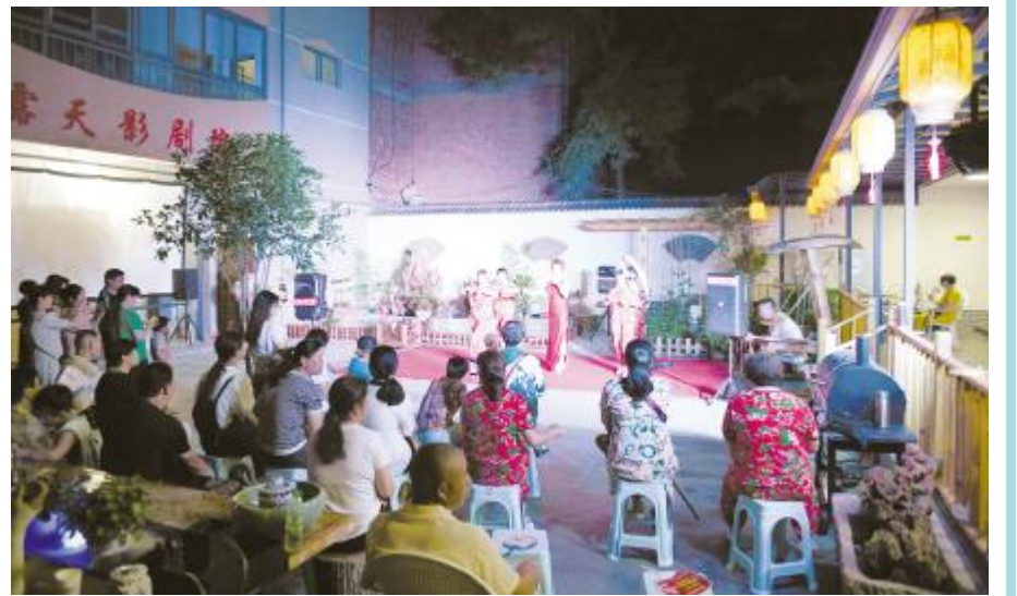
特色庭院演艺吸引众多观众