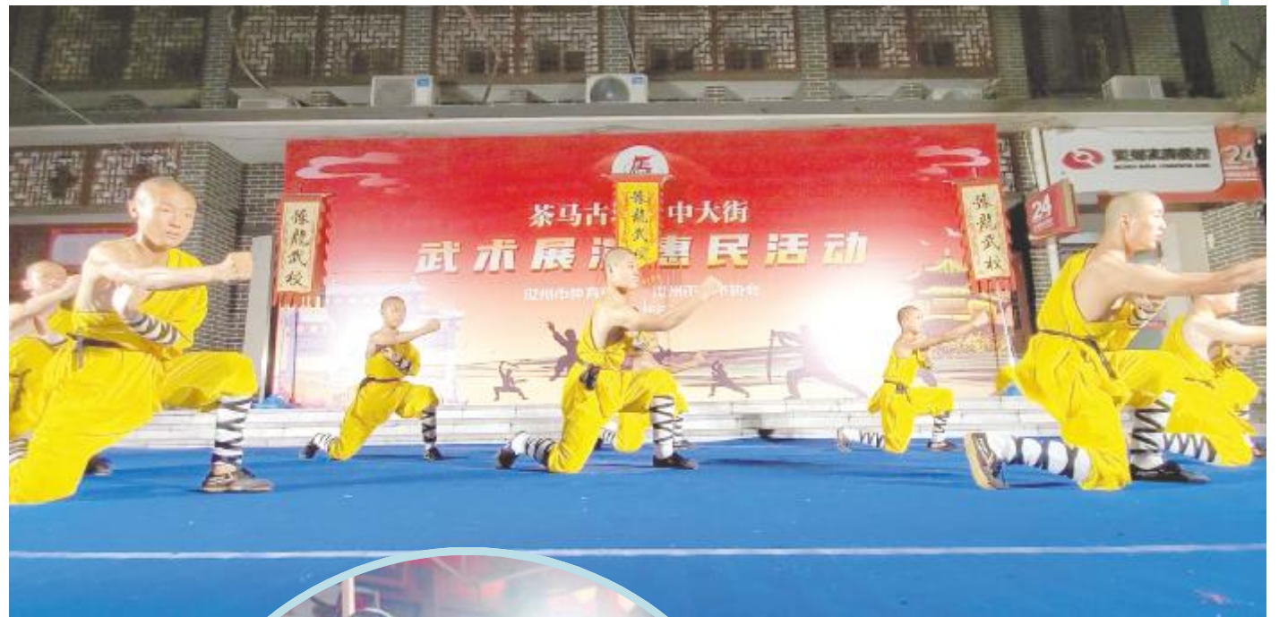
武术展演扣人心弦