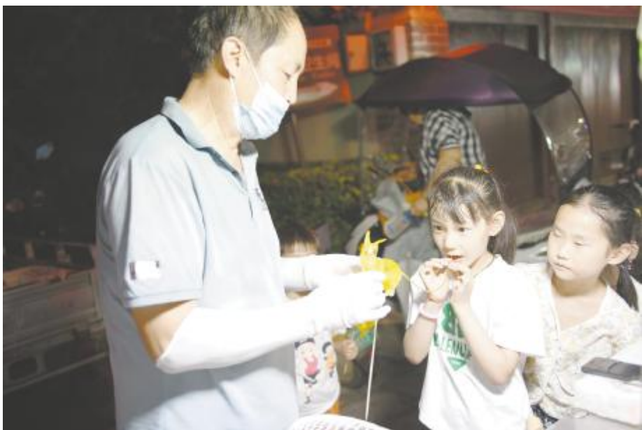
吹糖人受小朋友青睐