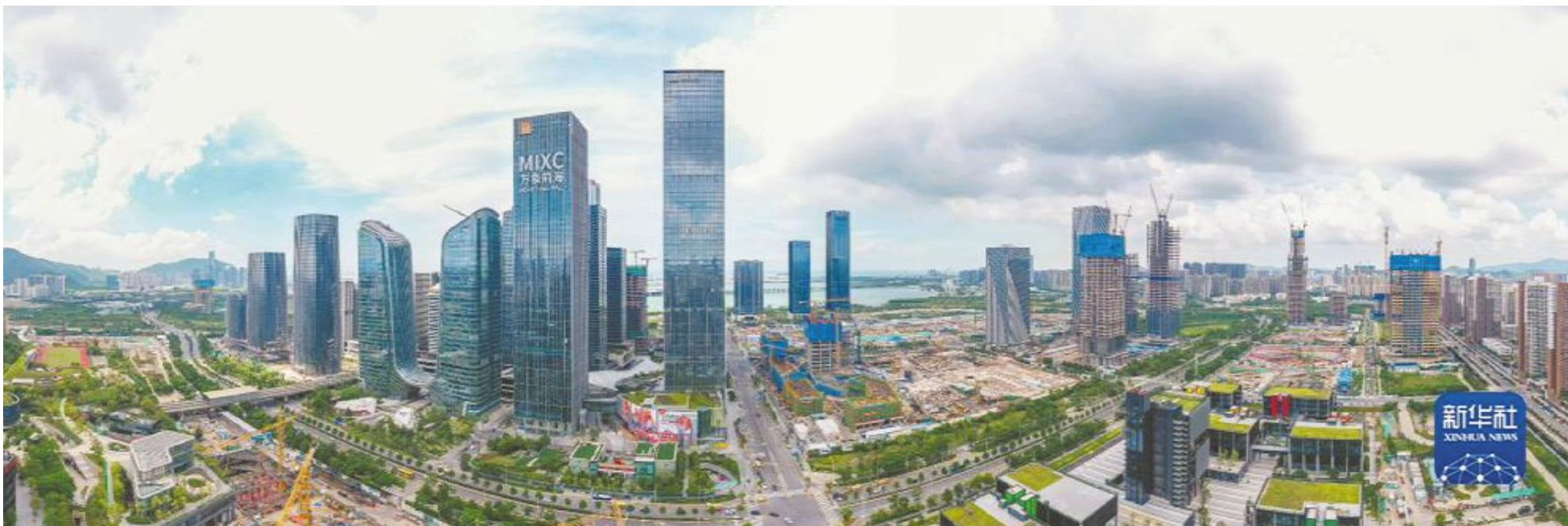
深圳前海深港现代服务业合作区(2021年9月8日摄，无人机全景照片)。