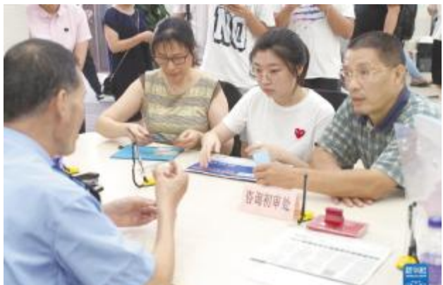
在上海市闵行区证照办理中心，民警在解答有关为香港居民办理居住证的手续问题(2018年9月1日摄)。

在香港期间，习近平总书记见证重要合作协议签署、考察重要基础设施，会见各界人士代表，亲身感受着狮子山下新的发展变化，也不断思考着“东方明珠”长治久安的根本之策。