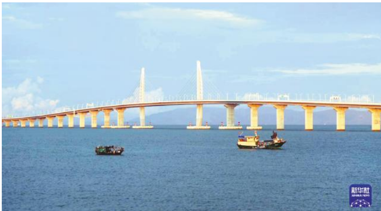
这是港珠澳大桥(2020年9月11日摄)。