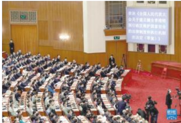
十三届全国人大三次会议表决《全国人民代表大会关于建立健全香港特别行政区维护国家安全的法律制度和执行机制的决定(草案)》(2020年5月28日摄)。