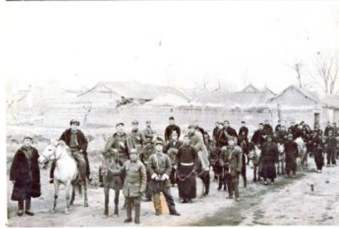
1949年1月10日，临汝县第一届农民协会全体委员骑马游行。此照片中的人物，你是否认识？此照片背后的故事你是否了解？