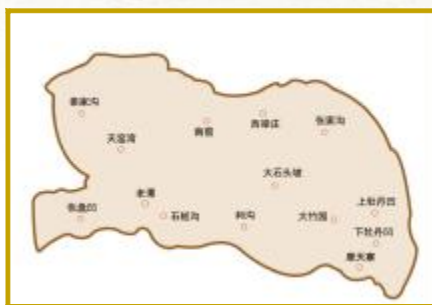
临汝县第一区、第二区抗日区政府行政区划图

面对日军和汉奸土匪武装的“围剿”和“扫荡”,临汝县委、抗日县政府组织县独立团、区干队、民兵和人民群众,配合八路军主力部队,从1944年11月到1945年8月日军投降,与日、伪、顽进行30多次战斗,取得了送表伏击战、袁窑保卫战、棉花窑反扫荡、孟窑阻击战、