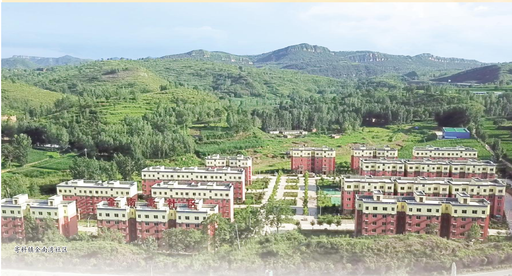
寄料镇金南湾社区