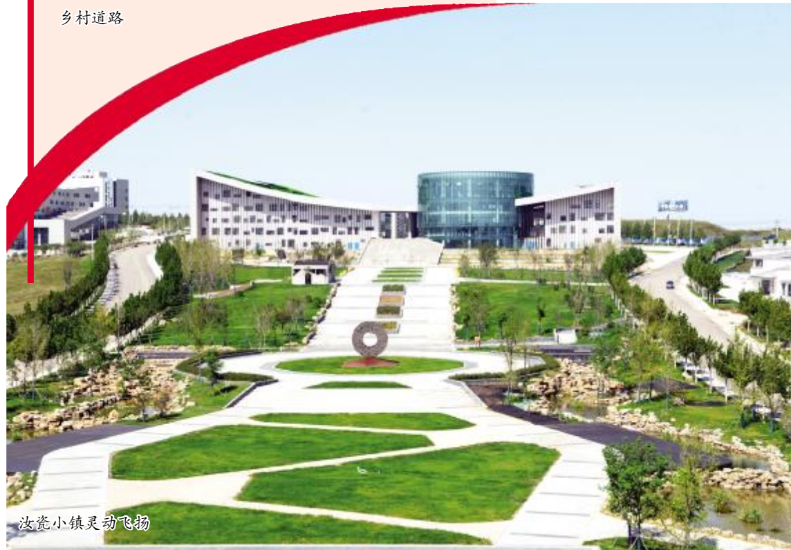
汝瓷小镇灵动飞物