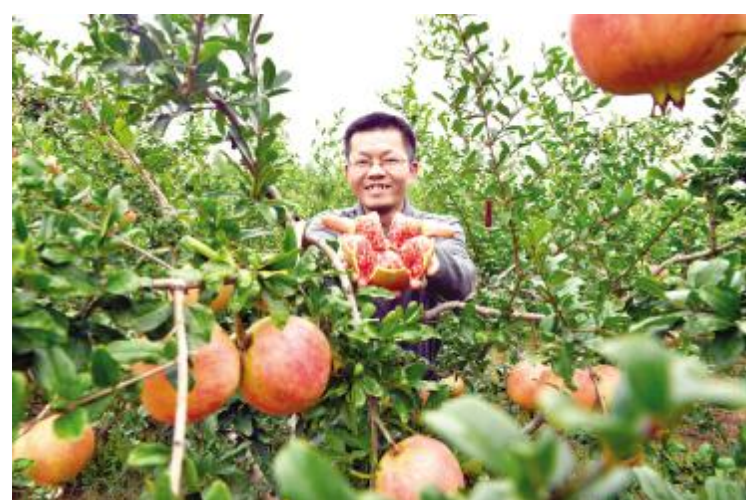
软籽石榴喜获丰收