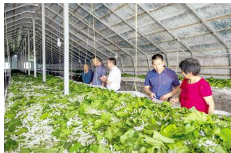
技术专家指导焦村镇桑蚕产业发展