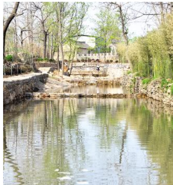
半孔古镇景色如画