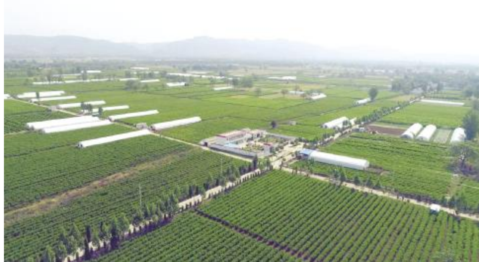
焦村镇蚕桑产业园