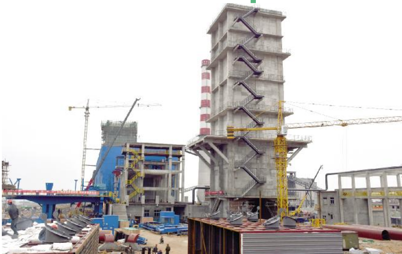
汝州市汝丰焦化有限公司装备大型化改造升级项目