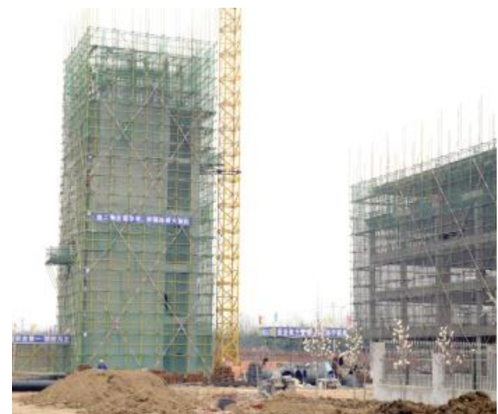
建设中的电梯试验塔