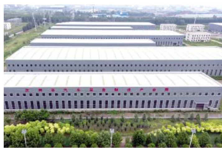
汝州市汽车装备制造产业园