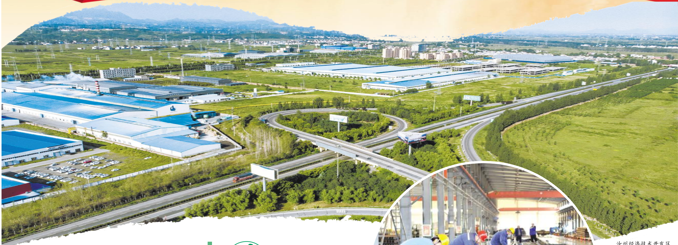
汝州经济技术开发区