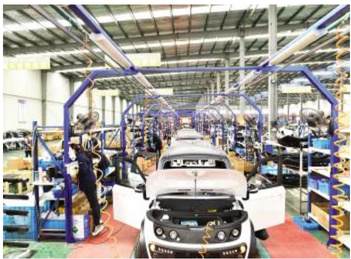
河南森地新能源汽车股份有限公司

92.5米，河南省第一高度的电梯试验塔就在汝州。这个用最新技术打造的河南省第一高度电梯试验塔，将成为汝州经济技术开发区的地标性建筑，而经它检验过的电梯将走向全国各地，甚至漂洋过海，引领人们在新的巅峰看见新的高度。