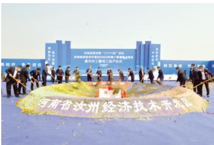
2022年第二季度重点项目集中开工暨竣工投产仪式