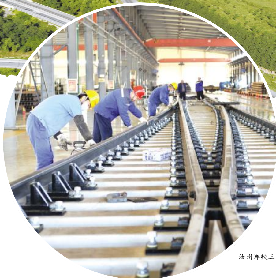
汝州郑铁三佳道岔有限公司