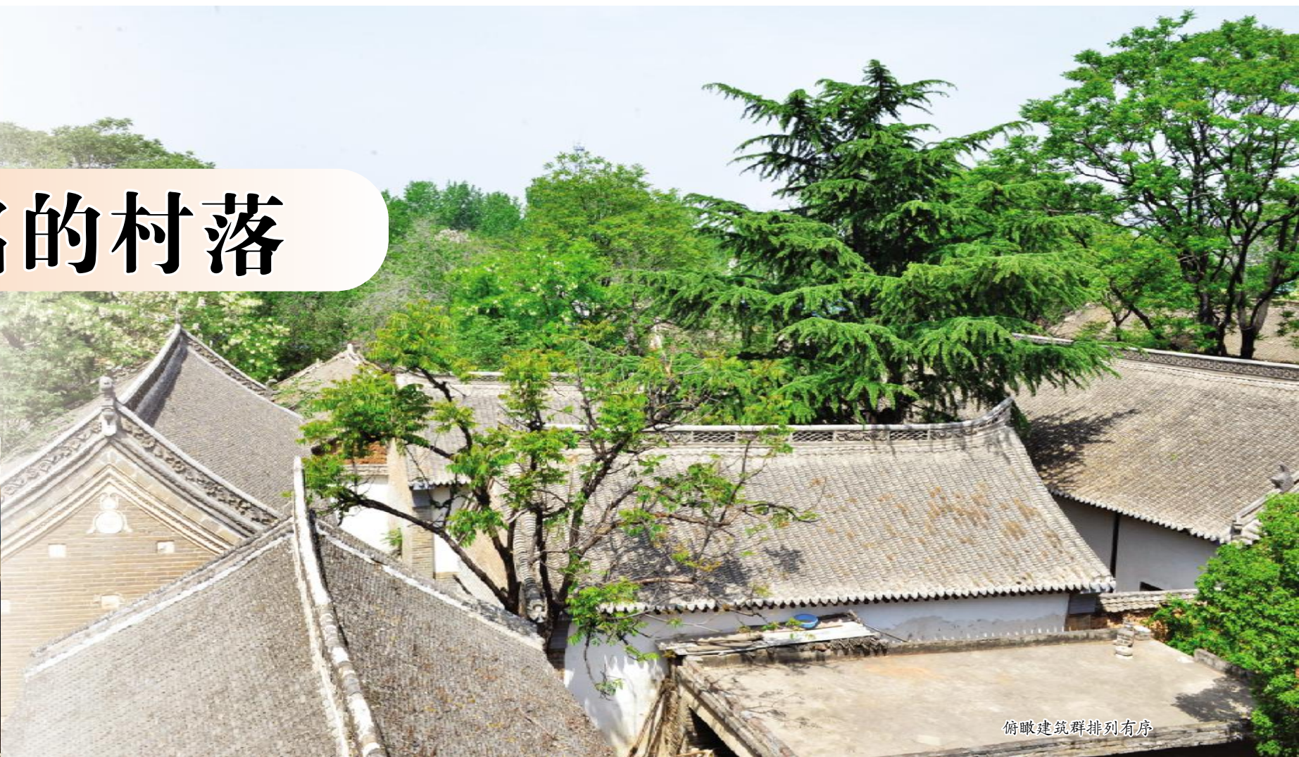
俯瞰建筑群排列有序

在我市焦村镇有一个村庄因一名姓张的进士而得名，被人简称——张村。只因为张村的张松茂在清朝嘉庆年间考取了进士，修建了进士府院、进士牌坊而被周围十里八乡的群众美誉为张进士村。