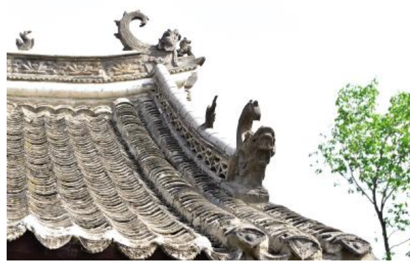
房顶五脊六兽栩栩如生