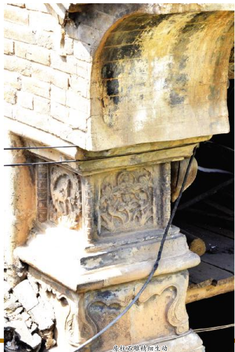
房柱石雕精细生动