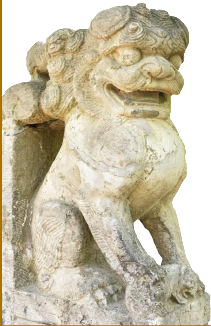
村口保存完好的石狮