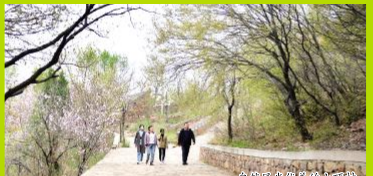
自然风光优美的山顶村