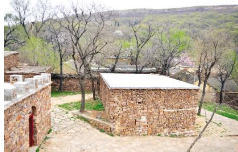
俯瞰山顶村建筑风貌