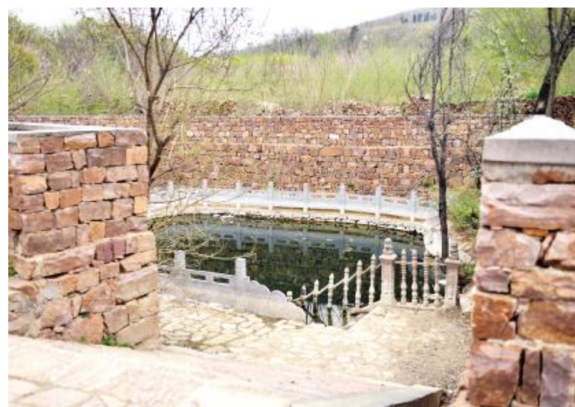
村中修葺后的饮水泉