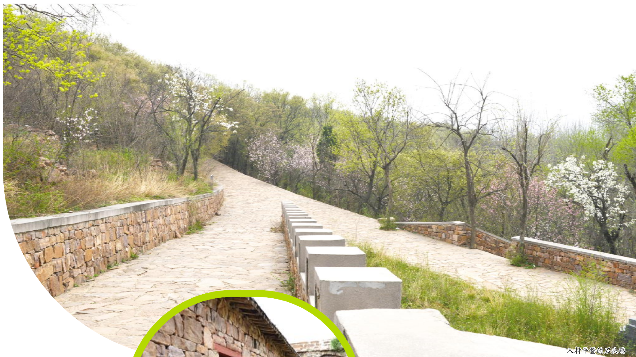
入村平整的石头路