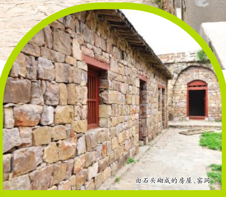
由石头砌成的房屋、窑洞