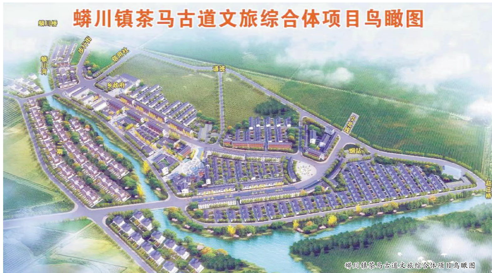
蟒川镇茶马古道文旅综合体项目鸟瞰图