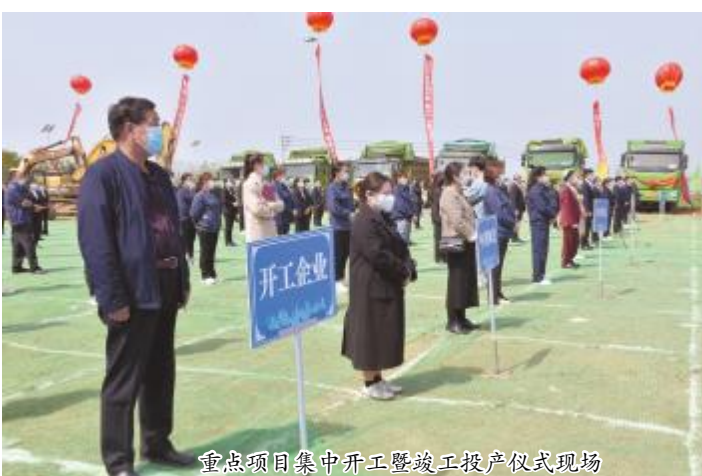
重点项目集中开工暨竣工投产仪式现场

(二)河南中祺陶瓷有限公司高端陶瓷工业4.0智能化生产线技改项目。该项目总投资3亿元,依托现有厂房,建设一条国内最先进的智能化、自动化、数字化大板、薄板陶瓷生产线。该生产线按照一级能耗标准设计,采用工业4.0智能系统进行管理控制,自动化程度高,能源消耗低,是当前国内中西部地区最大的大板、薄板陶瓷生