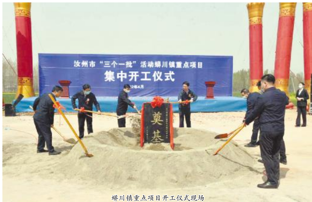
蟒川镇重点项目开工仪式现场